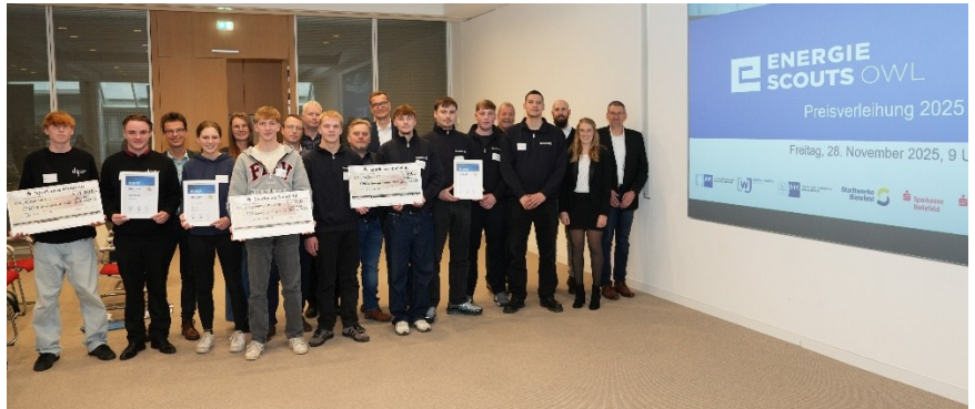
Bei der Preisverleihung 2025: Die Siegerteams mit der Jury