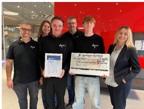
Das Siegerteam des Jahres 2025 kommt von Dorma-Glas.