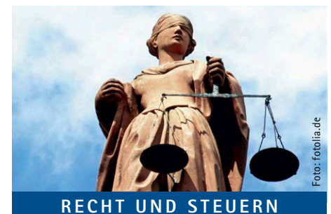
RECHT UND STEUERN

■ Weitere Infos: www.ihk-lehrstellenboerse.de und IHK, Rolf Ender, Tel. 0541 353-425 sowie ender@osnabrueck.ihk.de