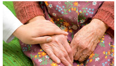
FÜR SIE DURCHGESETZT