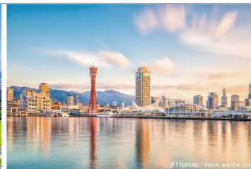
Osaka / Kobe