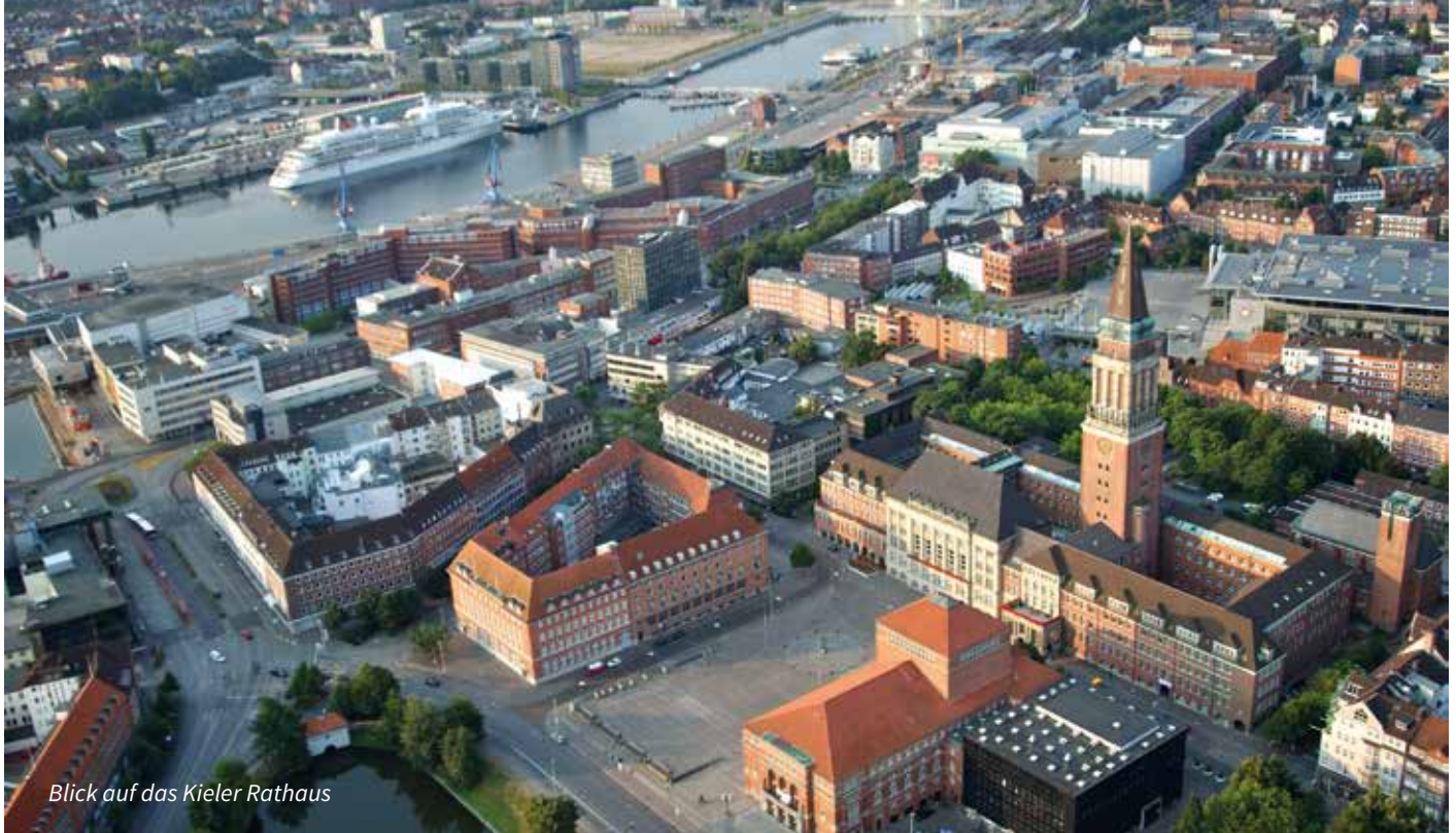
Blick auf das Kieler Rathaus