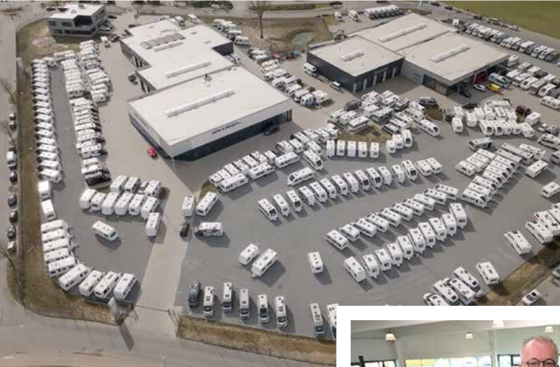
Bild oben: das neue Firmengelände in Reinfeld; Bild unten: Geschäftsführer Horst Spiertz in einem Showroom

Dieses Areal ist in Nordeuropa wahrscheinlich einzigartig: Hunderte Wohnmobile und Wohnwagen stehen auf gut 40.000 Quadratmetern für Campingliebhaber aus ganz Deutschland bereit. Ende 2022 hat die AUTO & FREIZEIT NORD GMBH ein neues Stammhaus in Reinfeld eröffnet.