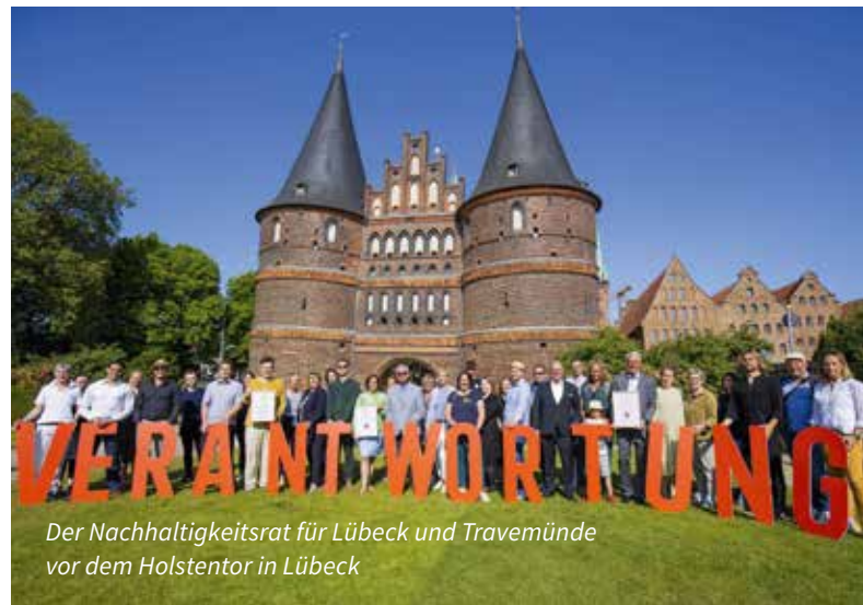
Der Nachhaltigkeitsrat für Lübeck und Travemünde vor dem Holstentor in Lübeck

Die Hansestadt Lübeck und Travemünde sind als nachhaltige Reiseziele zertifiziert. Im April 2022 hatte die Lübeck und Travemünde Marketing GmbH (LTM) in Kooperation mit DEHOGA Lübeck e.V. und Lübeck Management e.V. eine Nachhaltigkeitsoffensive ins Leben gerufen. Ziel der Initiative ist es, die Kräfte vor Ort zu bündeln und Betriebe mit dem unabhängigen TourCert-Siegel für Nachhaltigkeit und Unternehmensverantwortung im Tourismus und damit die gesamte Destination zertifizieren zu lassen. Das Engagement wurde nun mit dem TourCert-Siegel „Nachhaltiges Reiseziel“ anerkannt. Im Zertifizierungsverfahren von TourCert wurden destinationsweit Nachhaltigkeitsfaktoren analysiert und bewertet. Der Nachhaltigkeitsrat für Lübeck und Travemünde besteht aus verschiedenen Akteuren und Organisationen, unter anderem auch der IHK zu Lübeck. red ■