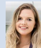
Jessyca Staedtler documentus GmbH Berlin