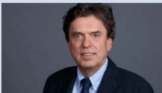
Christoph Meyer CM Realty GmbH