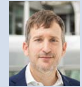
Roman Kaupert Zepter und Krone GmbH