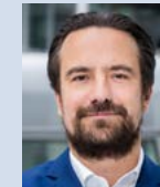
Robert Rückel Deutsches Spionagemuseum DSM GmbH