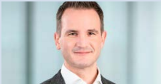
Manuel Mang Interautomation Deutschland GmbH

Der am 5. 12. 2022 konstituierte Ausschuss „Mobile Stadt“ unterstützt Vollversammlung und Präsidium bei der Entwicklung von Positionen für eine erfolgreiche Mobilitätswende. Es gilt, ein für alle zugängliches CO 2 -neutrales Mobilitätsangebot auf Straßen, Schienen und Wasserstraßen zu ermöglichen und für Berlin einen effizienten Wirtschaftsverkehr zu sichern. Deshalb zählen zukunftssicheres Laden und Liefern und die Integration neuer Formen der Mobilität in den ÖPNV ebenso zu den Kernthemen wie die bessere Einbindung des BER in den interkontinentalen Luftverkehr.