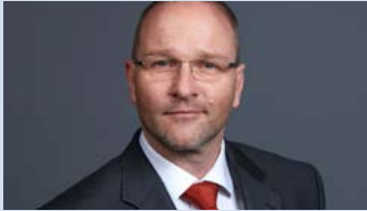
Bernhard Lemmé Nenn Entsorgung GmbH & Co. KG