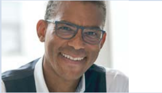
DanLahiri Agboli Opera Plun GmbH