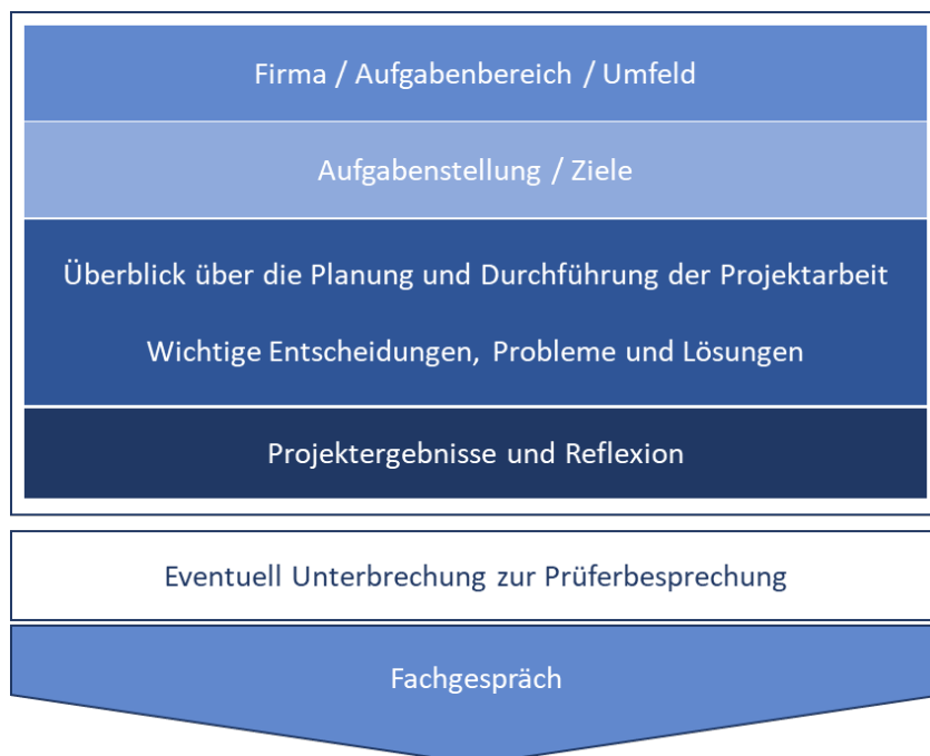
Abbildung 2: Möglicher Aufbau einer Präsentation

Mit der Präsentation hat der Prüfling nachzuweisen, dass er Projektergebnisse adressatengerecht präsentieren kann. Hierbei stehen die eigenen Leistungen und Ergebnisse im Vordergrund.