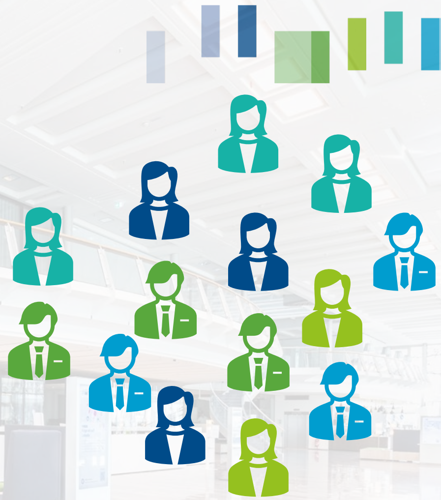
Präsidentin/Präsident und Präsidium