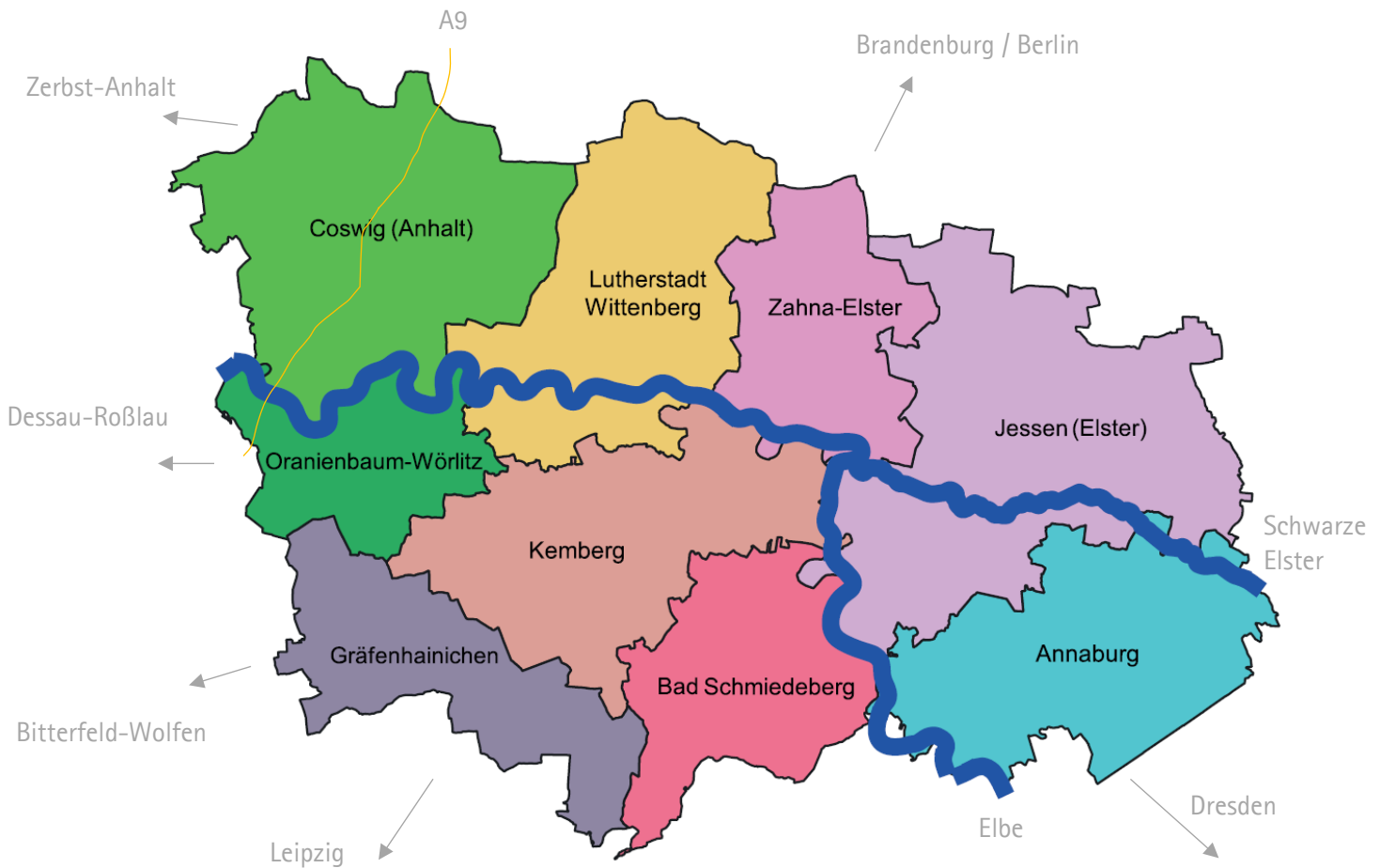
Schematische Darstellung des Landkreises Wittenberg