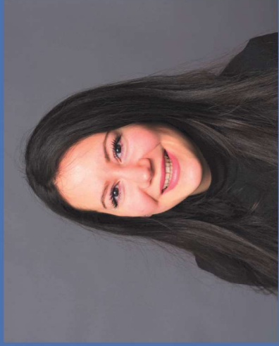
проектний координатор: Neşe Yıldız-Kendibaşina