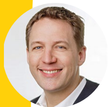
Frank Beckmann Schuhhaus Lötte GmbH & Co. KG, Bochum