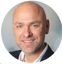
Maximilian Holthaus Jacobi Spedition GmbH, Bochum