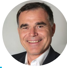
Roland Niggemeyer Niggemeyer Pro Imaging GmbH & Co. KG, Bochum