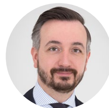
Marc Ostermann Einrichtungshaus Ostermann GmbH & Co. KG, Witten