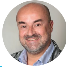
Christopher Schäfer Maschinenfabrik Köppern GmbH & Co. KG, Hattingen