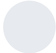
Kai Weyers Eickeler-VINOthek, Herne