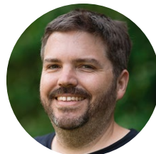
Matthias Hoffmann Grubengold GmbH, Bochum