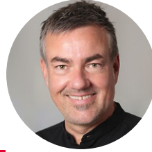
Lukas Ruger Livingroom GmbH & Co. KG, Bochum