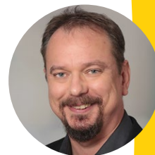
Eduard Paul IT-Akademie Dr. Heuer GmbH, Bochum