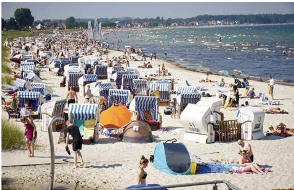
Strandabschnitt in Scharbeutz