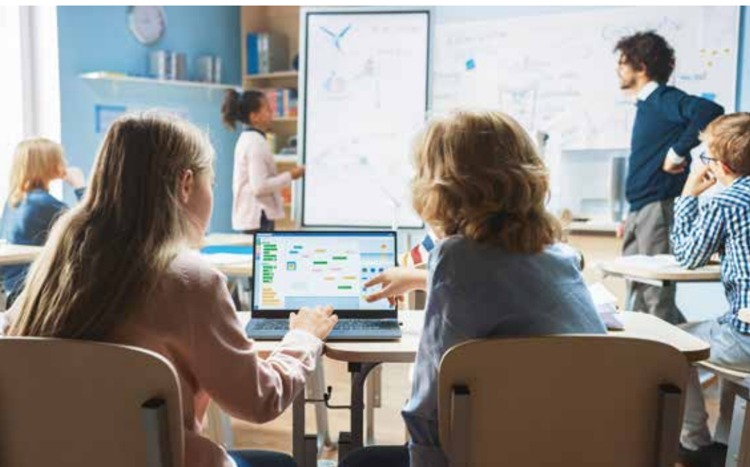
Unternehmerische Bildung gehört in die Schulpraxis, sind sich viele Akteure einig.

Positive Rückmeldung zum Konzept gibt es daher auch von Betrieben, da angehende Azubis mit idealem Vorwissen in eine Ausbildung starten.