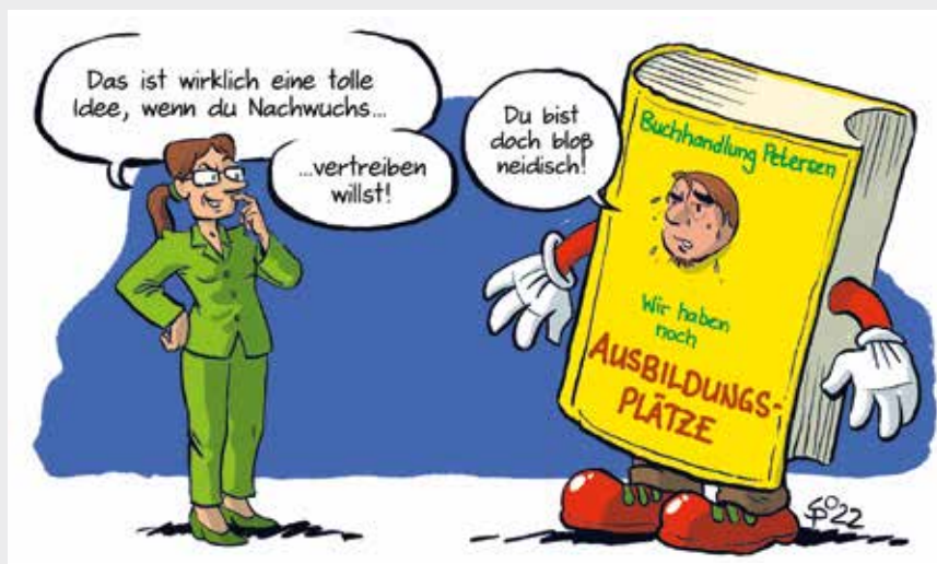
CARTOON: VOLKER SPONHOLZ