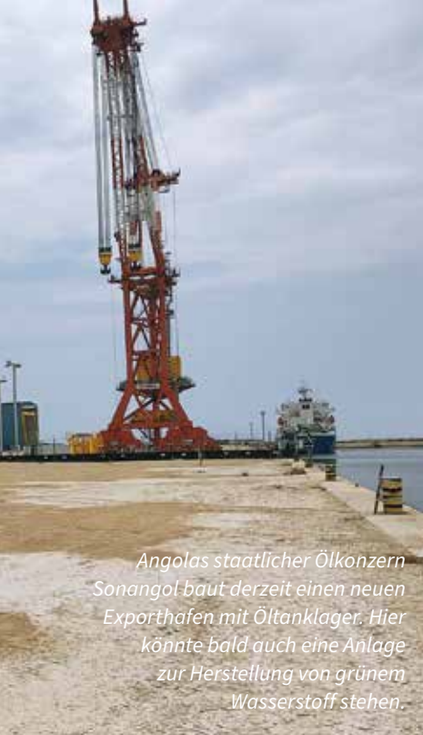
Angolas staatlicher Ölkonzern Sonangol baut derzeit einen neuen Exporthafen mit Öltanklager. Hier könnte bald auch eine Anlage zur Herstellung von grünem Wasserstoff stehen.

bis zum Baubeginn begleiten und dabei mit großen industriellen Abnehmern, Anlagenbauern und Investoren verhandeln. Wir sprechen schon mit vielen Interessenten für das Produkt, denn Europa braucht diese grüne Energie dringend. In den kommenden Wochen werden wir das Konzept fertigstellen und benötigen dann ein bis zwei Jahre für die technische Detailplanung. Die Bundesregierung teilt unsere Einschätzung, sie hat in Angola kürzlich ein Wasserstoffbüro eröffnet.