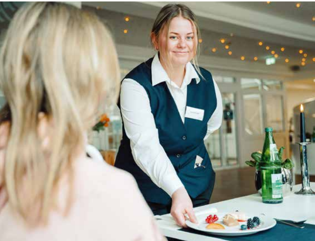
Angehende Helferin für das Gastgewerbe, hier im Bugenhagen-Ausbildungsbistro

Zwei Standorte, 50 Ausbildungsberufe, eine Prüfungserfolgsquote von 95 Prozent: Das BUGENHAGEN BERUFSBILDUNGSWERK in Timmendorfer Strand ist ein lebendiges Beispiel dafür, wie eine gut vernetzte Bildungsinstitution zu einem Partner von Unternehmen werden kann.