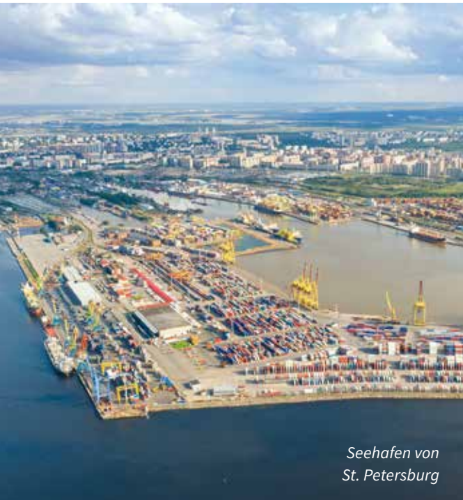
Seehafen von St. Petersburg

In einem Handelskrieg habe Russland langfristig mehr zu verlieren als die USA und ihre Alliierten. Zu diesem Schluss kommt eine Modellsimulation aus einem gemeinsamen Arbeitspapier des Instituts für Weltwirtschaft Kiel (IfW) und des Österreichischen Wirtschaftsforschungsinstituts (WIFO).