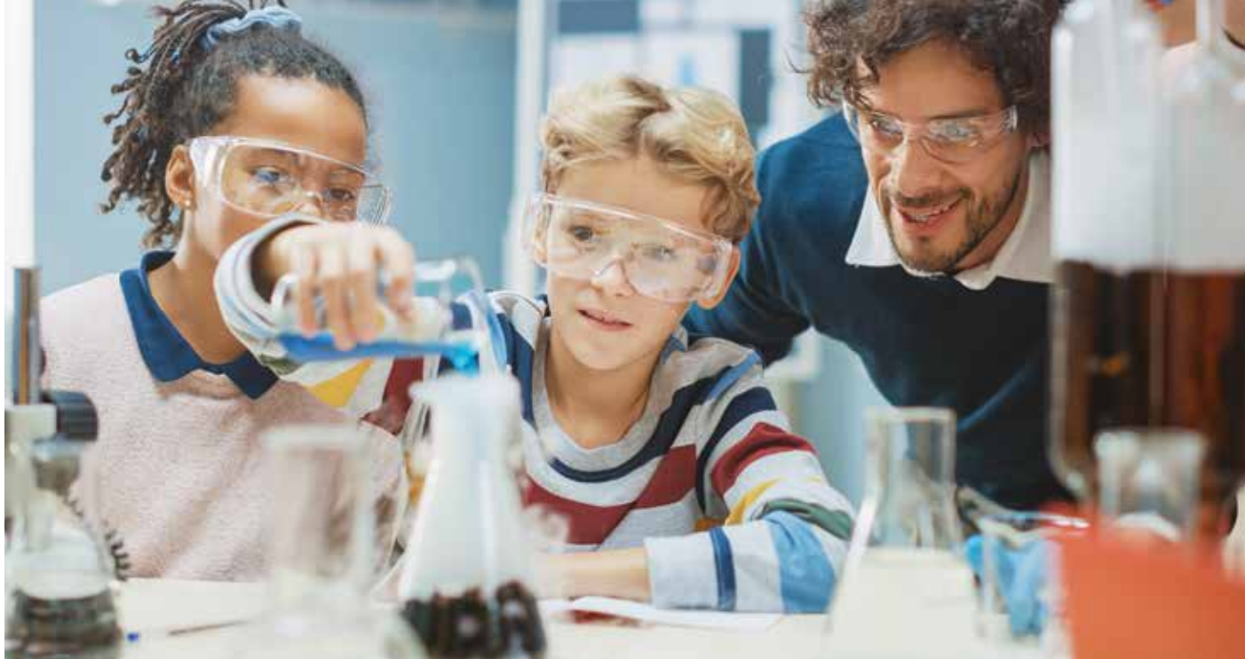
Neugierde für naturwissenschaftliche Berufe kann schon in Grundschulen geweckt werden.