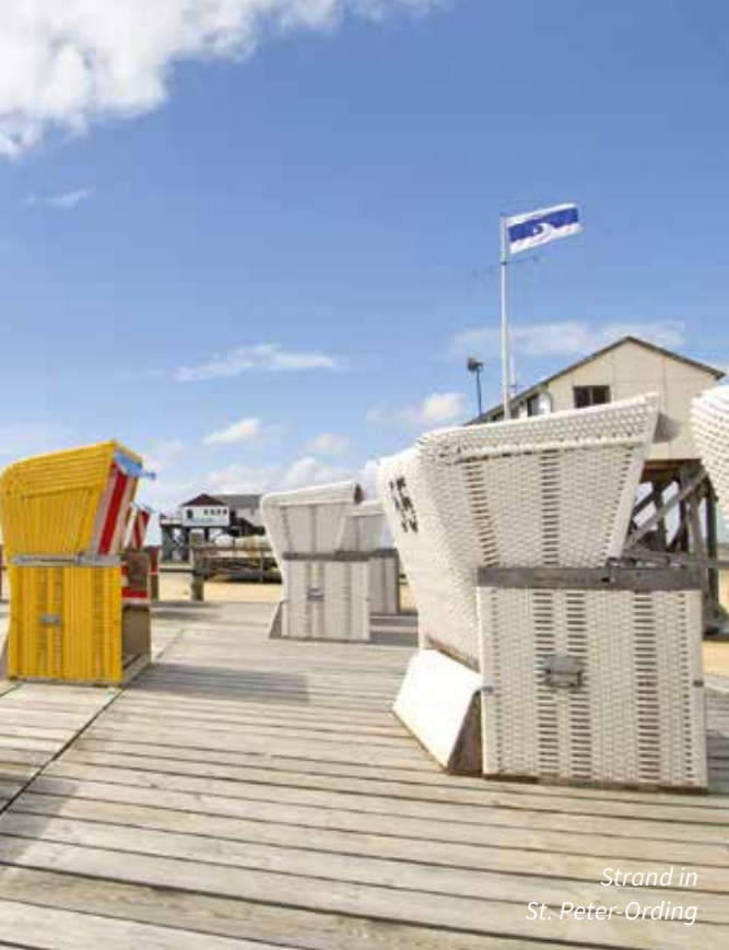
Strand in St. Peter-Ording