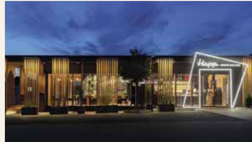
Bäckereifachgeschäft im flexibler Holzmodulbauweise in Bad Orb erbaut von BAUMGARTEN GmbH, Ebersburg (Neumann Architektur)