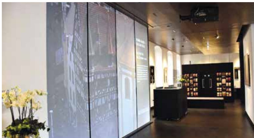
Erstrahlt in neuem Glanz: Die Tourist-Info im Palais Buttler