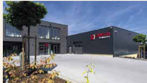
Büro- und Lagergebäude für ein Technologieunternehmen in Bad Soden Salmünster geplant und erbaut von BAUMGARTEN GmbH, Ebersburg

dere Wirtschaftlichkeit von Gewerbebauten in Holzbauweise. Zudem zählen sich intelligente Energiekonzepte und die hohe Flexibilität des Holz-Gebäudes für eventuelle Nutzungsänderungen langfristig aus.