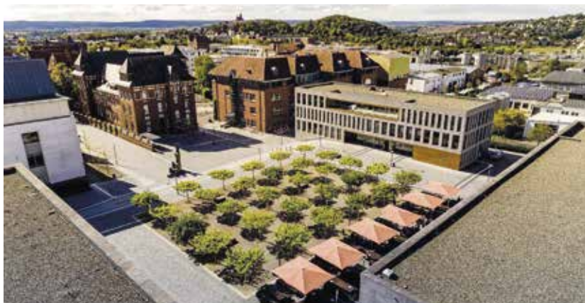
Der Campus der Hochschule Fulda

Entsprechend der im Dezember 2021 beschlossenen Novelle des Hessischen Hochschulgesetzes (Paragraph 71) können Bewerber:innen die für die Übertragung einer Professur erforderliche dreijährige außerhochschulische Berufspraxis im Rahmen einer Tandem-Professur erwerben. Tandem-Professor:innen werden mit dem hälftigen Umfang innerhalb und außerhalb der Hochschule – wie beispielsweise in einem Unternehmen – eingestellt.