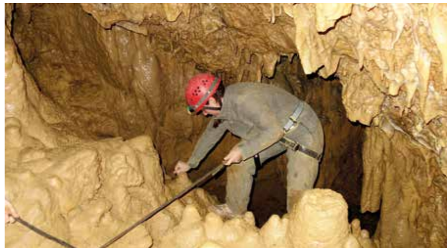
Beim Abseilen in der Höhle müssen sich die Teilnehmer aufeinander verlassen können und sich an Regeln halten.

Der Tag endet mit unserem Grillbuffet, bei dem sich die Gruppe stärken und austauschen kann. Auch hier fragen wir die Bewerber, was sie gelernt haben und welche Erfahrungen sie für sich mitnehmen können. Das ist allerdings ganz zwanglos, weit entfernt von einer Bewerbungsinterview-Situation. Wir haben in den vergangenen Tagen ja bereits viel durch Beobachten über die Teilnehmer erfahren. So entsteht dann langsam aber sicher ein runder Eindruck von jedem einzelnen.