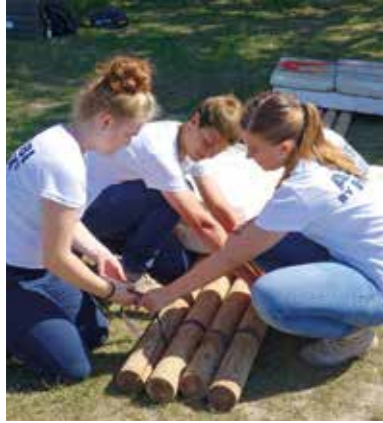
An Tag zwei bauen Gruppen von vier bis fünf Bewerbern je ein Floß – hier ist Kreativität gefragt.