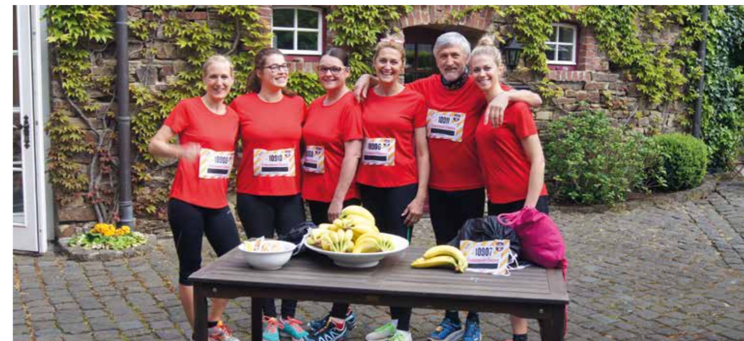
Gemeinsame Events spielen eine große Rolle, hier beim Fishermans Run in Nürnberg.

Wer in den Bewerbungsgesprächen ein gutes Bild hinterlassen hat, den laden wir zum 2-tägigen Schnupperarbeiten ein. Hier durchlaufen die Bewerber die notwendigen Abteilungen wie Service, Küche, Housekeeping oder Rezeption. Bewerber als künftige Koch-Azubis bleiben beispielsweise in der Küche und im Service. Wer im Endeffekt einen Ausbildungsplatz bekommt, entscheiden wir nach den zwei Tagen im Team.