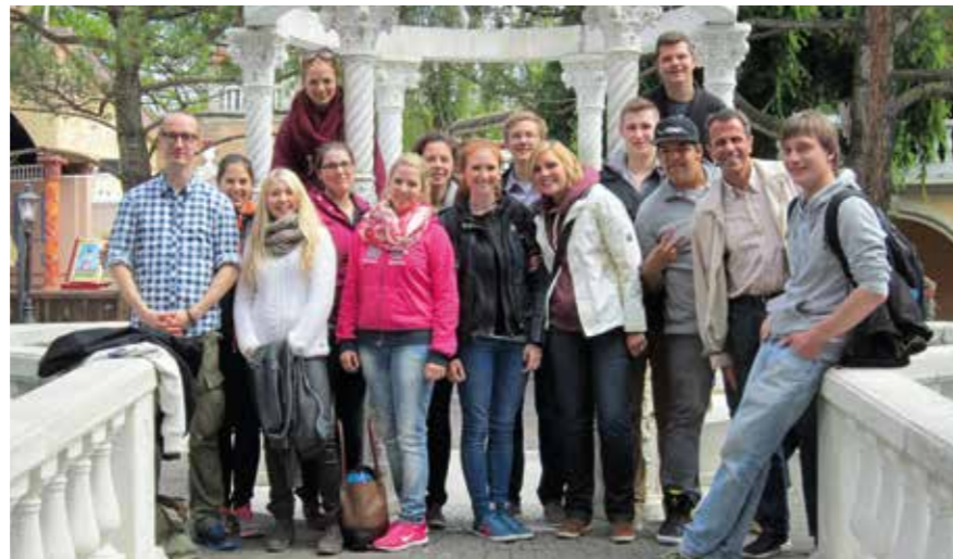
Ein Ausflug in die Region ist für die Azubis Fortbildung und Spaß gleichermaßen.

Lesen Sie, wie das Parkhotel Frank seine hohen Qualitätsansprüche über die richtige Auswahl seiner Auszubildenden und Mitarbeiter sowie eine umfangreiche Aus- und ständige Weiterbildung im Betrieb umsetzen kann.