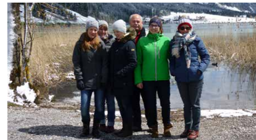
Auch das Rezeptionsteam macht regelmäßig Ausflüge, um Touristen später Empfehlungen geben zu können.

Geht es dem Mitarbeiter gut, geht es auch den Kunden gut. Das heißt für uns, dass wir zwar viel von unseren Mitarbeitern fordern, sie im Gegenzug aber auch viel von uns fordern dürfen.