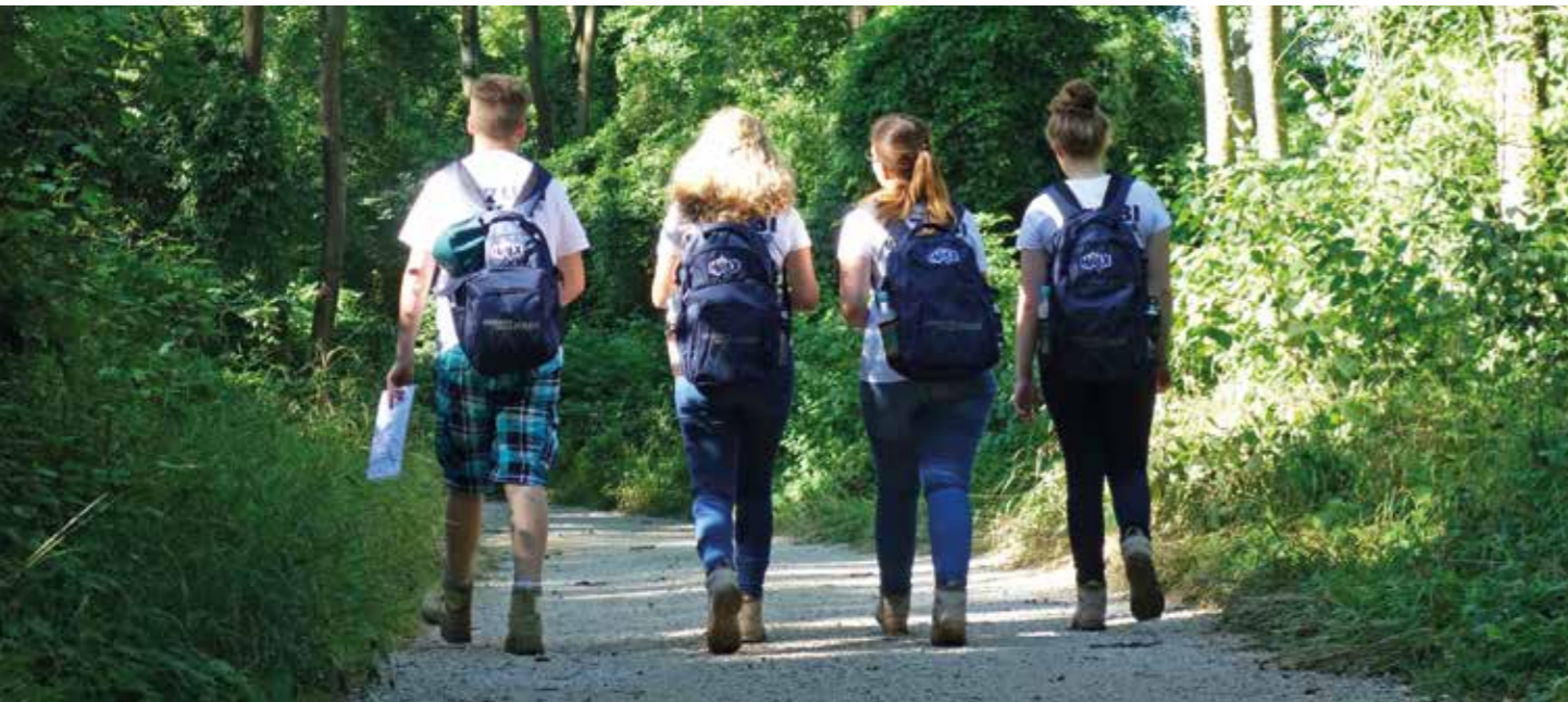
Orientierung mittels GPS-Gerät: Teamarbeit und gute Kommunikation führen zum Erfolg.

Lesen Sie, wie Haix es mithilfe eines mehrtägigen Programms schafft, nicht nur die Bewerberzahl – trotz hoher Konkurrenz – zu erhöhen, sondern vor allem die am besten geeigneten jungen Leute für die freien Ausbildungsplätze zu finden.