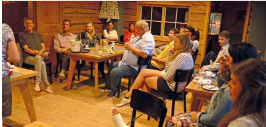
Einmal im Quartal wird ein besonders engagierter Mitarbeiter ausgezeichnet.

Jede Abteilung gibt über den Abteilungsleiter eine schriftliche Beurteilung ab. Diese besteht aus einem Bogen, bei dem unterschiedliche Kategorien nach Schulnoten bewertet werden, etwa das Interesse am betrieblichen Ablauf, Geschicklichkeit, Auffassungsvermögen, die Arbeitsqualität, Eigeninitiative, das Verhalten gegenüber Kollegen und Vorgesetzten. Zusätzlich gibt es Raum für Bemerkungen. Gibt es zwei negative Stimmen, ist klar, dass wir den Bewerber nicht nehmen. Ein Kriterium ist beispielsweise, ob der Bewerber aufmerksam ist. Begreift er schnell, was ihm gesagt wurde und setzt es auch um? Oder muss ihn der Kollege, der ihn während der Zeit anleitet, häufiger auf dasselbe aufmerksam machen? Und das für uns Wichtigste: Hat der Bewerber Freude daran, es unseren Gästen so angenehm wie nur möglich zu machen? Ist er freundlich und bietet von sich aus seine Hilfe an – etwa an der Rezeption. Kurz gesagt: Hat er einen hohen eigenen Qualitätsanspruch an seine Arbeit? Natürlich können die Bewerber nicht wissen, was unser langjähriges Personal weiß. Aber wenn sie sich bemühen, sich vielleicht Hilfe bei Kollegen organisieren, um eine Frage eines Gastes beantworten oder einen Wunsch erfüllen zu können, ist es genau das, was wir sehen wollen.