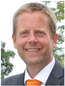
Grave, Ole Inhaber Ole Grave SOL.Service Online Hameln