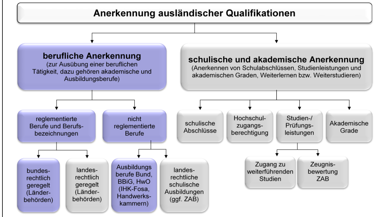
Abb.: Übersicht zu Anerkennungswegen in Deutschland (die blauen Felder zeigen den Anwendungsbereich des Anerkennungsgesetzes)

setzes, z.B. Ärzte, Krankenpfleger, Rechtsanwälte) sowie 41 reglementierte Handwerksmeisterberufe (zulassungspflichtiges Handwerk, Anlage A der Handwerksordnung) dazu.