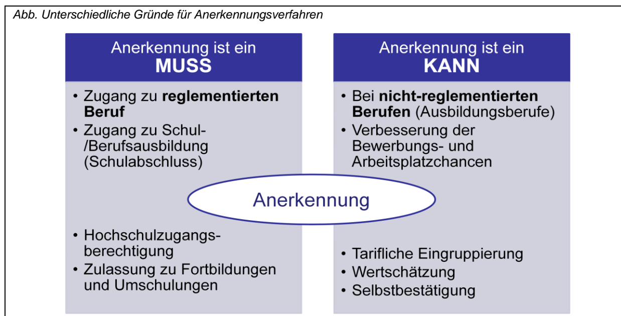
Abb. Unterschiedliche Gründe für Anerkennungsverfahren

Die Prüfung der Gleichwertigkeit hat bei den reglementierten und den nicht-reglementierten Berufen eine unterschiedliche Funktion und damit auch unterschiedliche Rechtsfolgen : Für den Berufszugang und die Ausübung eines reglementierten Berufes ist die Anerkennung der entsprechenden Berufsqualifikation zwingend erforderlich. Bei nicht-reglementierten Berufen ist es dagegen möglich, sich auch ohne formales Anerkennungsverfahren direkt auf dem Arbeitsmarkt zu bewerben und zu arbeiten.