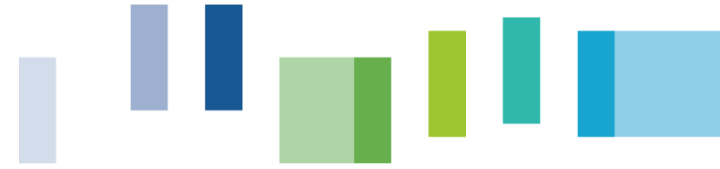
Abbildung der Wertschöpfungsketten: