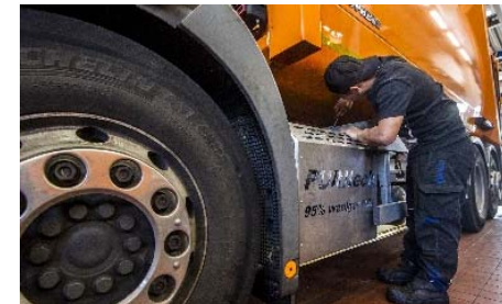
„NO x -Umrüstung in der Bestandsflotte“ Berliner Stadtreinigungsbetriebe AöR