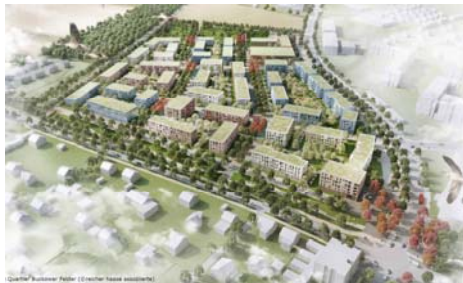
„Nachhaltiges Stadtquartier für 900 Mietwohnungen“ STADT UND LAND Wohnbautengesellschaft mbH