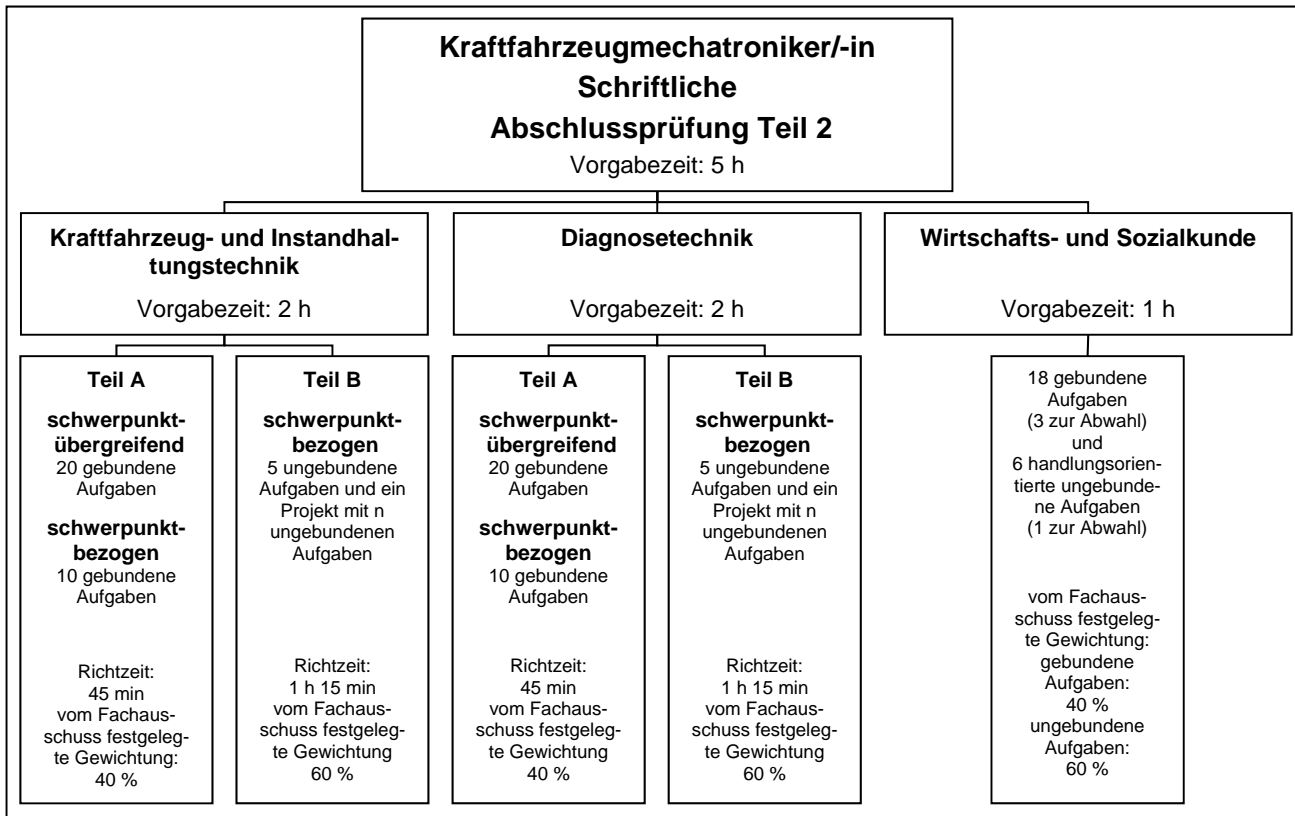
Gliederung der schriftlichen Abschlussprüfung Teil 2