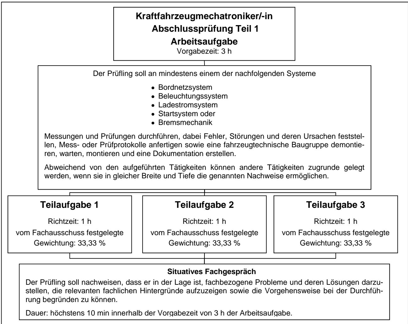
Gliederung der Arbeitsaufgabe/Abschlussprüfung Teil 1