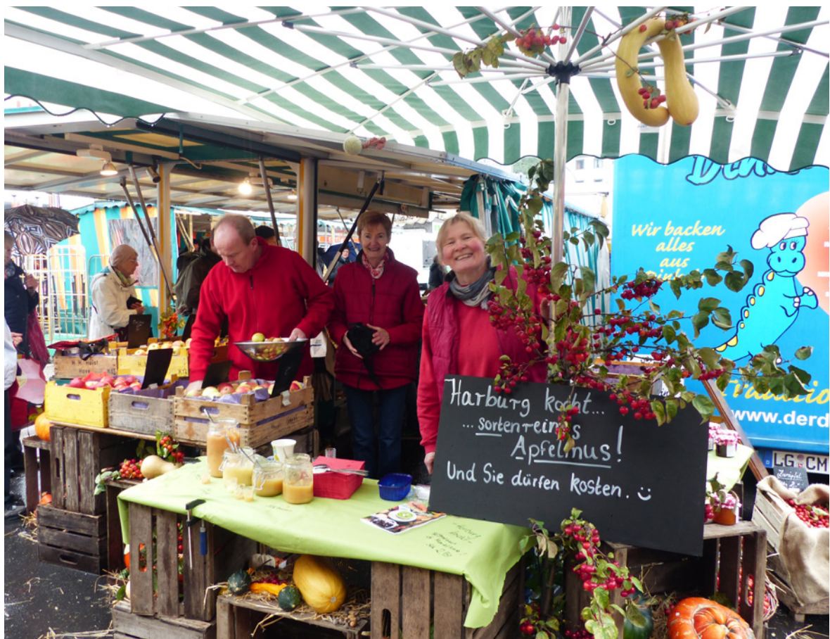
Wichtiger Magnet für die Harburger Innenstadt: der Wochenmarkt auf dem Sand, der im Rahmen eines BIDs neugestaltet wurde

In diesem Positionspapier der Handelskammer Hamburg fokussieren wir uns auf die Rahmenbedingungen für die Citymanagements, Quartiersinitiativen, Interessengemeinschaften und für die Business Improvement Districts (BIDs). Wir knüpfen damit an das Eckpunktepapier „Shoppingmetropole Hamburg 2030“ (2018) und das Standpunktepapier „Bündnis für die Innenstadt“ (2019) an.