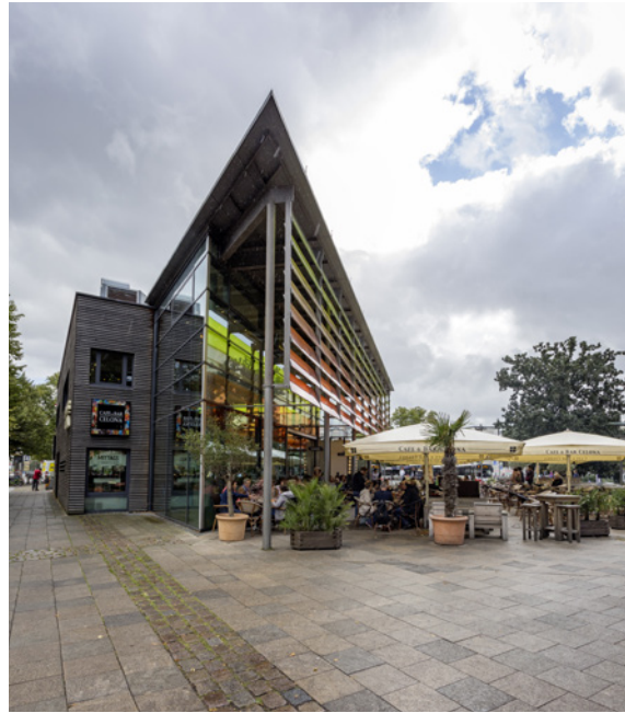
Zu einem lebendigen Quartier gehört auch die Gastronomie: der Wandsbeker Markt

Wir sind davon überzeugt, dass die Stadt Hamburg mit den vorgeschlagenen Maßnahmen einen wichtigen Beitrag für erfolgreiche kleine und mittlere Unternehmen, für zukunftsfähige und nachhaltige Quartiere und für mehr Lebensqualität in Hamburg leisten kann. Das Geld, das die Stadt hier investiert, ist gut angelegt und macht spätere, weitaus größere Ausgaben bei der Städtebauförderung entbehrlich.