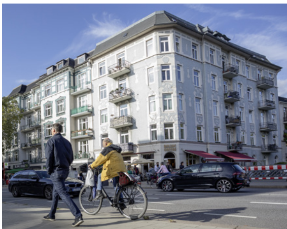
Quartiere sind wichtiger Baustein für die Lebensqualität Hamburgs: der Eppendorfer Baum

Am Ballindamm in der Innenstadt ging die Initiative zur Schaffung von Velo-Routen von der Stadt aus. Hier werden verschiedene Maßnahmen zur Schaffung von mehr Aufenthaltsqualität im Rahmen eines BIDs realisiert. Ähnliche Projekte sind auch für das Rathausquartier und für die Carl-Petersen-Straße in Hamm geplant.