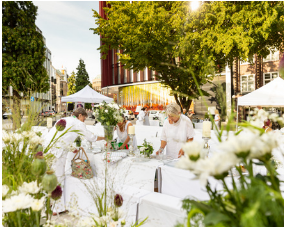
Bringt Menschen in die Innenstadt: White Dinner auf dem Heuberg

Deutschlandweit einzigartig sind die vielen Business Improvement Districts (BIDs), in denen die Grundeigentümer und Unternehmen seit 2005 knapp 69 Mio. Euro in die Neugestaltung und Pflege des öffentlichen Raums, in Service- und Marketingleistungen investieren. Sie tun dies nicht nur aus Altruismus, sondern auch aus wohlverstandem, eigenem Interesse.