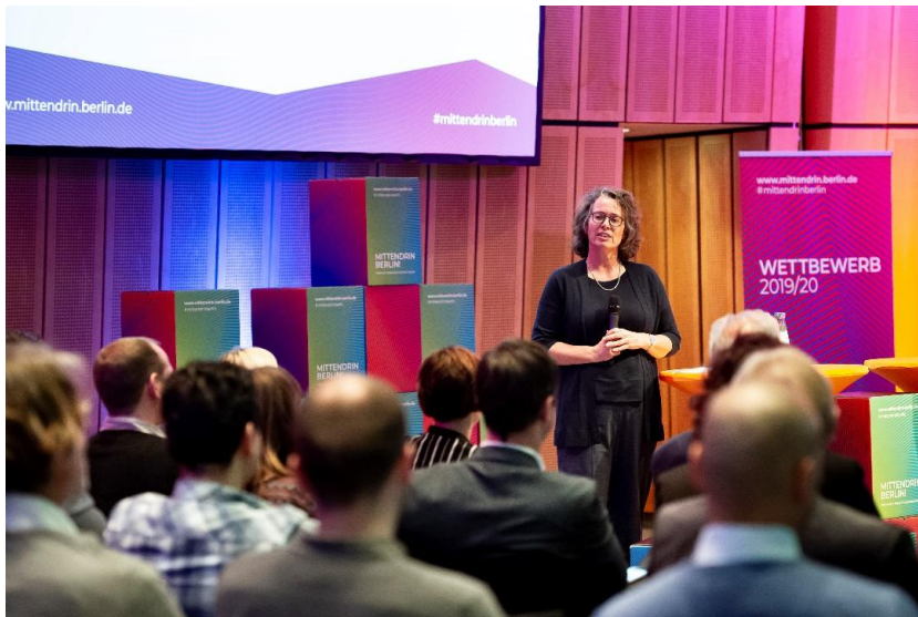
Wettbewerb MittendrIn Berlin!, 15.05.2019