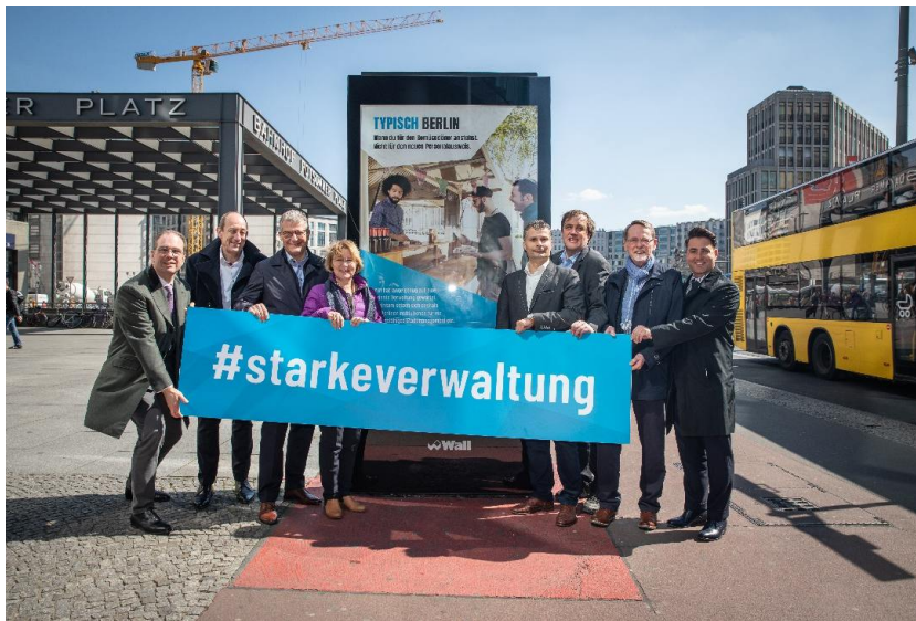
Auftakt der Plakatserie, 16.04.2019