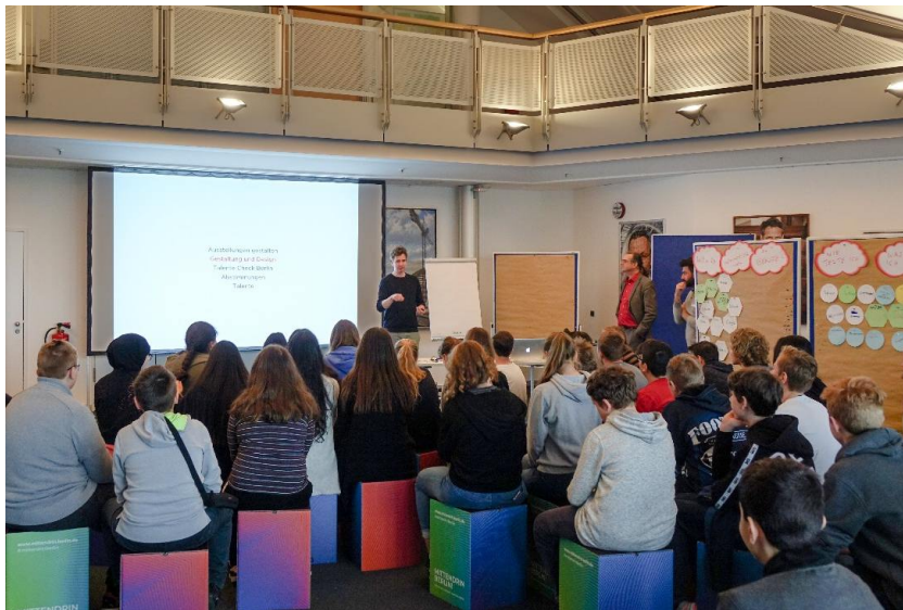
Vorstellung des Design-Konzepts Talente Check bei der IHK Berlin, 16.05.2019