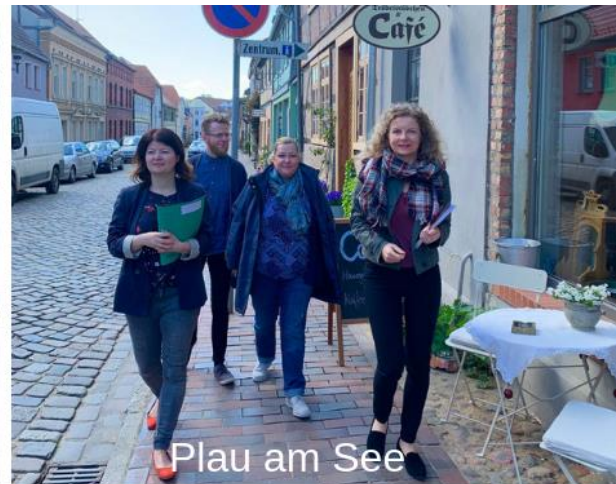
Plau am See