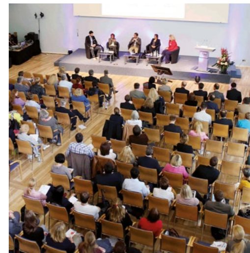
IHKs informieren ausführlich zur betrieblichen Gesundheitsförderung – wie hier die IHK für München und Oberbayern.