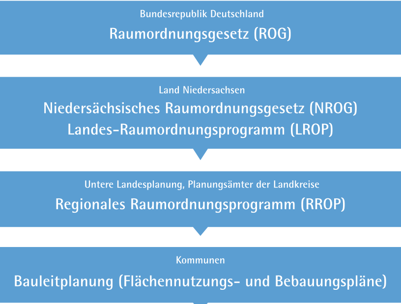
Vereinfachte Darstellung der geltenden Planungsebenen im Elbe-Weser-Raum, IHK Stade, 2017

Das Land Niedersachsen ist zu großen Teilen durch ländliche Kreise geprägt. Diese Besonderheit findet Ausdruck in den Landesgesetzen und -regelungen zur räumlichen Entwicklung.