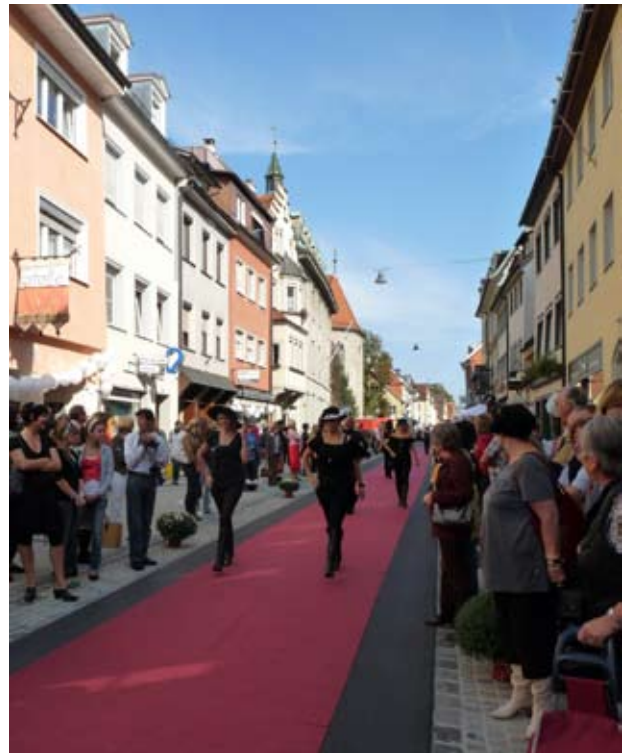
Laufsteg: Ein roter Teppich zum Eröffnungsfest

die aus Verantwortlichen der „Initiative Ravensburg“, der Verwaltung, der Bauleitung sowie der Anrainer bestand, beschlossen und realisiert.