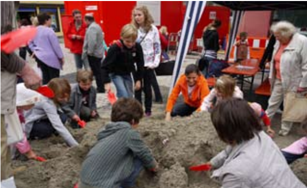
Marketing-Aktion des GHV auf der Baustelle

Um stets alle Bürger über die aktuellen Entwicklungen zu informieren, geben die städtische Pressestelle und die Marketingabteilung der ENRW in enger Zusammenarbeit regelmäßige Medieninformationen heraus. Zudem wurde auf der städtischen Homepage www.rottweil.de eigens eine neue Rubrik „Rottweil-Mitte“ eingerichtet. Hier finden Anwohner, Gewerbetreibende, Erwerbstätige, Touristen und Kunden alle Informationen, um trotz der Baustelle ihren Alltag gut zu bewältigen. Das Angebot im Internet wurde ferner durch einen Info-Container auf dem Kapellenhof, mitten auf der Baustelle, ergänzt. Interessierte können dort die Planunterlagen einsehen und den Verlauf der Arbeiten verfolgen. Zudem sind dort alle Informationen zur geänderten Verkehrsregelung sowie die geänderten Fahrzeiten und Fahrtrouten der Stadtbuslinie erhältlich.