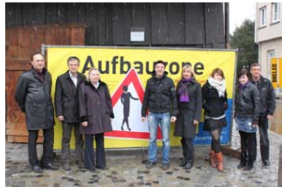
Präsentation des Werbebanners „Aufbauzone“ durch Mitglieder der Initiative Ravensburg anlässlich des Beginns der Bauarbeiten