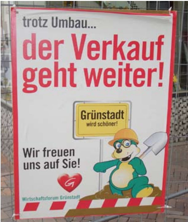
Bauzaun-Banner mit Maskottchen, Grünstadt