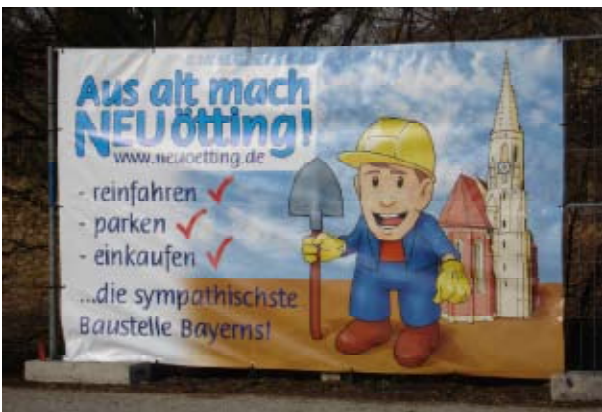
Bauzaun-Banner mit Maskottchen, Neuötting