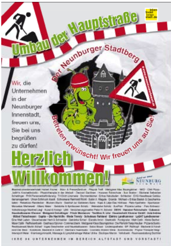
Baustellenplakat, Neunburg vorm Wald