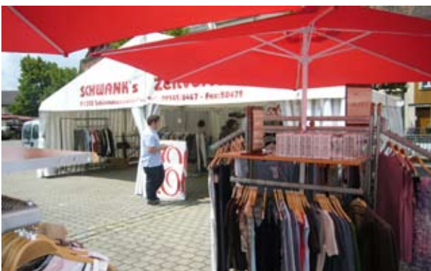
Ersatzverkauf in Zelten auf dem Paradeplatz während der Bauphase, Forchheim