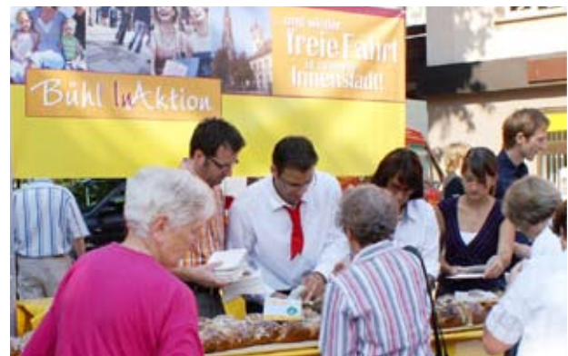
Aktion „Freie Fahrt in unserer Innenstadt“

Wichtig für den reibungslosen Ablauf war, dass die Anlieger direkt auf diese Personen zugehen konnten und kleine Probleme oftmals auch mit den Verantwortlichen auf der Baustelle direkt geregelt werden konnten. Ein weiterer Vorteil bestand darin, dass für die Durchführung aller Bauabschnitte Firmen aus der unmittelbaren Umgebung beauftragt wurden. Dieser „kurze Draht“ unter den Akteuren schaffte ein hohes Maß an gegenseitigem Verständnis und Bemühen, Unannehmlichkeiten so weit wie möglich zu vermeiden.