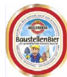
Etikett Baustellen-Bier, Neuötting