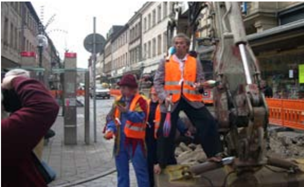
Baustellen-Gaukler, Fürth