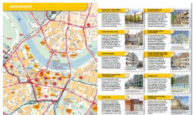
Dritter Baustellen-City-Guide des City Managements Dresden e.V.