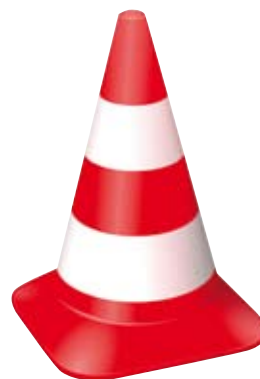
Baustellen-Logo der Stadt Heidelberg