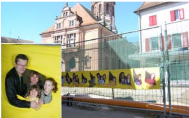
Fotoaktion „Zaungäste“ als Bauzaungestaltung

Die Innenstadtgemeinschaft Bühl InAktion e.V. war für das Baustellenrahmenprogramm verantwortlich. Insgesamt wurden über vier Jahre hinweg rund 100.000 € für vielfältigste Marketingaktivitäten ausgegeben. Zum Markenzeichen des Bühler Baustellenmarketings entwickelte sich ein 1,5 m breiter „Blauer Teppich“ aus Kunstrasen, der in den jeweiligen Bauabschnitten für einen sicheren Tritt sorgte und den Passanten anzeigte, wo sie die Baustelle queren bzw. wie sie zu den Geschäften gelangen konnten.