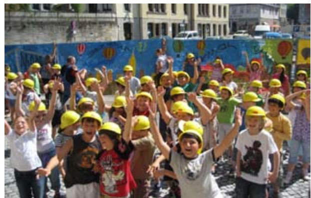
Galerie auf Zeit in der Baubude (oben) und Bauzaugestaltung durch Schüler (unten), Coburg Foto: Stadtmarketing Coburg, Annette Kolb, 2010