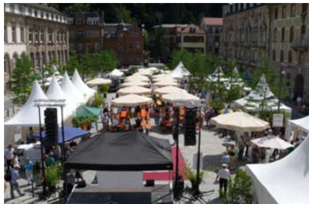
Einweihungsfeier Friedrich-Ebert-Platz Juli 2010

Mittel aus dem Unterstützungsfonds können Betriebe erhalten, deren wirtschaftliche Situation durch die Baumaßnahme nachweisbar Existenz bedrohend beeinträchtigt ist, denen jedoch kein Rechtsanspruch auf Entschädigung zusteht. Die Unterstützung aus dem Fonds ist eine freiwillige Leistung, über die ein unabhängiger Beirat entscheidet. Er setzt sich aus drei Personen zusammen, die ihr Fachwissen aus den Bereichen Recht, Immobilienwirtschaft, Finanz- und Steuerrecht einbringen. Die Beiratsmitglieder werden durch den Oberbürgermeister ernannt.