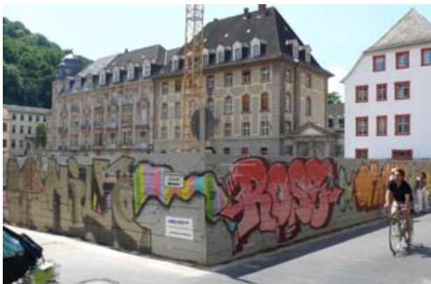
Gestalteter Bauzaun mit Graffiti und Schaulöchern

Um die negativen Auswirkungen von großen und längerfristigen Baumaßnahmen für Gewerbebetriebe im Baustellenbereich abzumildern und Härten auszugleichen, richteten die Stadt Heidelberg, die Stadtwerke Heidelberg GmbH und die Heidelberger Straßen- und Bergbahn GmbH im Jahr 2002 einen gemeinsamen Unterstützungsfonds ein, aus dessen Mitteln Bau begleitende Marketingmaßnahmen zugunsten der Gewerbetreibenden im Baustellenbereich finanziert sowie finanzielle Unterstützungsleistungen im Einzelfall gewährt werden können. Mit der Einrichtung des „Fonds für freiwillige Unterstützungsleistungen bei großen Tiefbauarbeiten“, kurz Baustellenunterstützungsfonds, entsprach die Stadt einem Wunsch des Heidelberger Gemeinderates. Die beteiligten Partner stellen jährlich ein Budget von 100.000 € für den Fonds zur Verfügung. Je nach Art der Baumaßnahme werden die Kosten anteilig zwischen Stadt und Stadtwerken aufgeteilt.