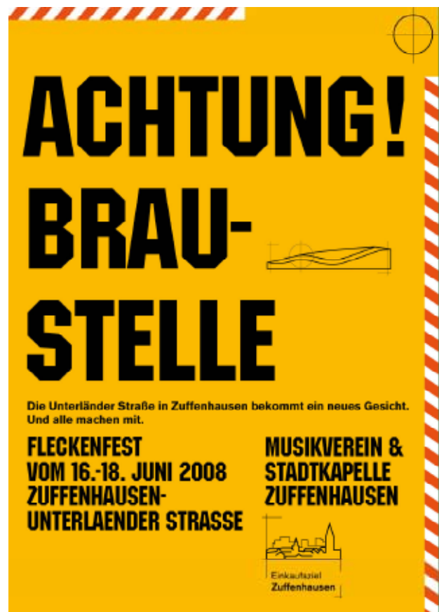
Plakat und Anzeige zum Zuffenhäuser Fleckenfest Grafik: EZZ

proaktiv begleitet und Konzepte erarbeitet und umgesetzt werden, die das geschäftliche Umfeld langfristig stärken.