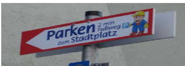
Ausschilderung Ersatzparkplatz (oben) und Baustellen-Kantine (unten), Neuötting