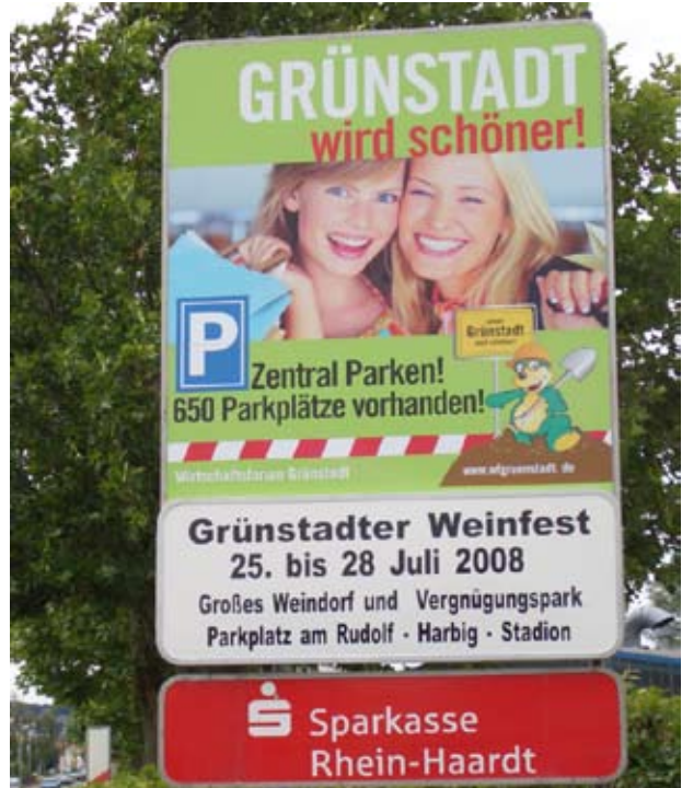
Informationsschild am Ortseingang, Grünstadt