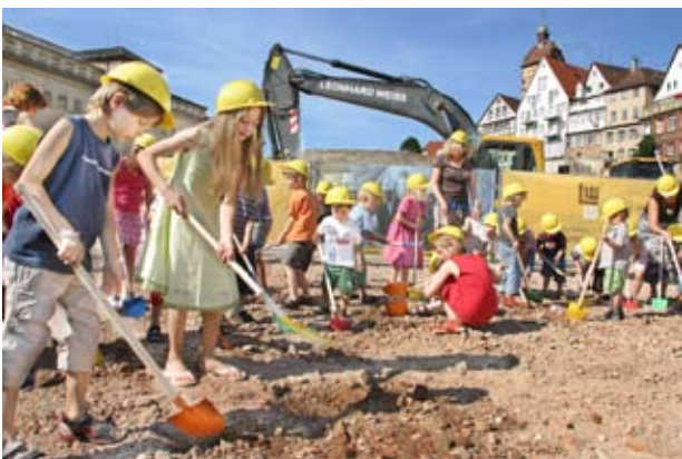
Symbolträchtiger „Spatenstich“ durch Kinder am 28. Juli 2008 – Ausdruck der engen Beziehung zwischen Tradition und Zukunft im Kocherquartier

Seit 160 Jahren prägt das im Volksmund „Kocherhotel“ genannte Gefängnis am Froschgraben das Stadtbild von Schwäbisch Hall. Mit der derzeit laufenden vollständigen städtebaulichen Umstrukturierung des Kocherquartiers geht eine mehrere Jahrzehnte dauernde Phase der planerischen und finanziellen Unsicherheit zu Ende. Zudem besteht die Chance, in unmittelbarer Anbindung an die historische Innenstadt von Schwäbisch Hall wichtige Ergänzungsfunktionen zur Stärkung des Stadtzentrums anzusiedeln. So sind eine Reihe von Fachmärkten, eine Bank, Dienstleistungseinrichtungen und Stadtwohnungen vorgesehen. Angesichts der wichtigen Rolle, die das Gefängnis für die Geschichte Schwäbisch Halls im 19. und 20. Jahrhundert gespielt hat, kann nur begrüßt werden, dass der denkmalgeschützte Ursprungsbau in neuer Funktion weitgehend erhalten bleibt.