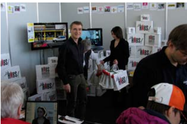
„Habs“-Tragetaschen als Eye catcher

Zahlreiche Events und Baustellenaktionen trugen dazu bei, die unvermeidlichen Belästigungen durch Verkehrsbehinderungen, Staub und Lärm erträglicher zu machen und die Motivation der betroffenen Gewerbetreibenden, am „Ball zu bleiben“, deutlich zu erhöhen. Diese Maßnahmen wurden je zur Hälfte von der Stadt Freiburg einerseits sowie durch die Interessengemeinschaft und Sponsoren andererseits finanziert.