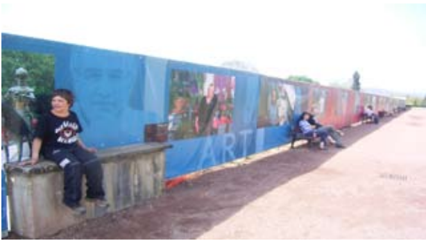
Bauzaugestaltung durch Imageposter der Stadt, Metz