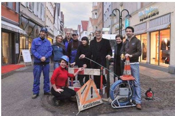
Baustelleneinrichtung mit OWIgut-Verantwortlichen

Im diesem Zuge wurde die städtebauliche Erneuerung in neun Bauabschnitte eingeteilt. Dabei sollen jeweils Bodenbeläge, das Beleuchtungskonzept und die Möblierung des öffentlichen Raums komplett neu gestaltet werden. Hinzu kam, dass die Stadtwerke „Fair Energie“ im Rahmen der Baumaßnahme alle unterirdischen Leitungen neu verlegen mussten. Dazu war ein Aufriss aller Straßenbereiche notwendig.