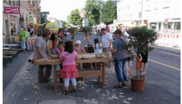
Kinderaktion beim Sommerfest 2009