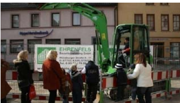
Baggern für Kinder, Karlstadt Foto: CIMA GmbH, 2008