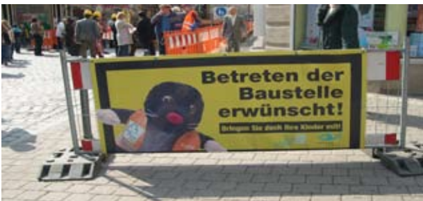
Baustellen-Banner mit Maskottchen, Fürth