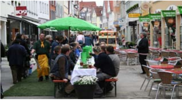
Vesper mit Bauarbeitern

Das Sommerfest (vor den Schulferien) fand mit einem attraktiven ‚Schnäppchenmarkt‘ (SSV) statt, unterstützt mit einem Anzeigenkollektiv und vielen Klein-Aktivitäten. Unter dem Kürbis-Symbol wurde zum großen Herbstfest in die fertig gestellte obere Wilhelmstraße eingeladen: Kürbis in allen essbaren Varianten und zum Schnitzen für Kinder. Grüne Tüten in einer zweiten Auflage beherrschten das Straßenbild.