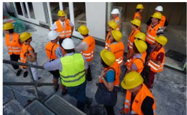
Baustellenführung durch Beschäftigte der Grundstücks- und Wohnungsbaugesellschaft Schwäbisch Hall mbH

Maßnahmen, wie ein Bauzeitenplan auf der städtischen Homepage, eine Webcam, die jederzeit Einblicke in das Geschehen der Baustelle gibt, sowie eine vermehrte Öffentlichkeitsarbeit in Zusammenarbeit mit der örtlichen Presse gehören bereits zum Alltag. Vor-Ort-Baustelleninformationen an der VR Bank und am Badtorweg ermöglichen interessierten Passanten, sich die Baustelle anzuschauen und sich über das geplante Projekt umfassend zu informieren.