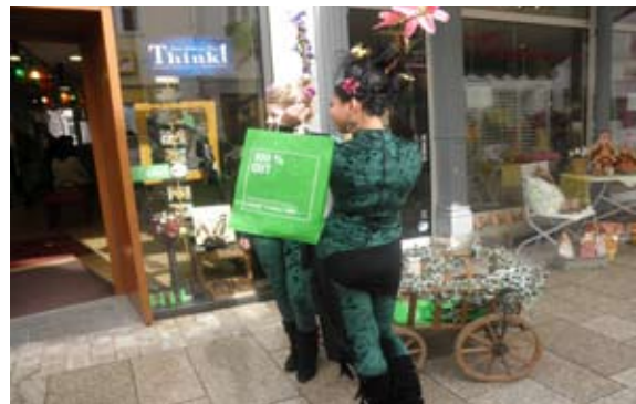
Frühlingsfest-Auftakt: OWIgut-grüne Feen verteilen Give-aways

Da das ‚Baustellenmarketing‘ der Stadt sich im Wesentlichen auf Hinweisschilder und Postkarten beschränkte, war man sich seitens OWIgut schnell bewusst, umfassendere eigene Aktivitäten zu entwickeln.