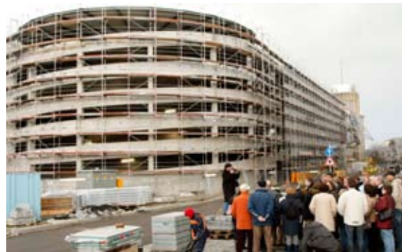
Baustellenfahrten und -führungen für die interessierte Bevölkerung sowie für Touristen, Essen