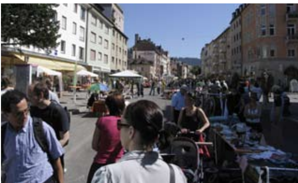
Sommerfest 2009; Flohmarkt auf der Habs'

Der marode Zustand von Kanalisation und Straßenbahngleisen machte eine vollständige Tiefbausanierung der Habsburgerstraße erforderlich. Diese mehr als zwei Jahre währende Baumaßnahme wurde ferner zum Anlass genommen, den Straßenzug auf ganzer Breite von Hauskante zu Hauskante städtebaulich aufzuwerten und verkehrlich zu beruhigen.