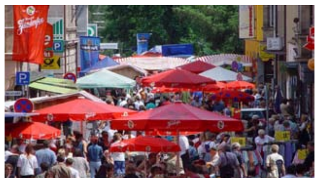
Baustellenfest, Zirndorf Foto: CIMA GmbH, 2006