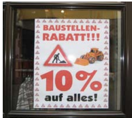
Baustellen-Rabatt, Weilheim