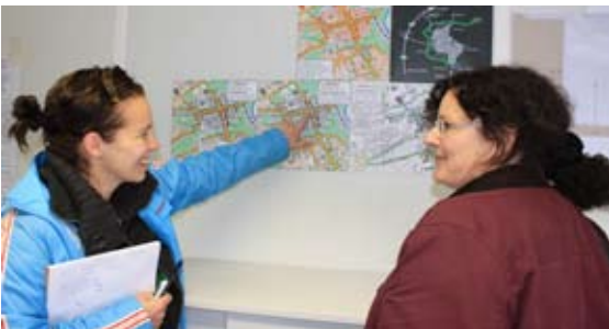
Im Info-Center der Baustelle

Um stets alle Bürger über die aktuellen Entwicklungen zu informieren, geben die städtische Pressestelle und die Marketingabteilung der ENRW in enger Zusammenarbeit regelmäßige Medieninformationen heraus. Zudem wurde auf der städtischen Homepage www.rottweil.de eigens eine neue Rubrik „Rottweil-Mitte“ eingerichtet. Hier finden Anwohner, Gewerbetreibende, Erwerbstätige, Touristen und Kunden alle Informationen, um trotz der Baustelle ihren Alltag gut zu bewältigen. Das Angebot im Internet wurde ferner durch einen Info-Container auf dem Kapellenhof, mitten auf der Baustelle, ergänzt. Interessierte können dort die Planunterlagen einsehen und den Verlauf der Arbeiten verfolgen. Zudem sind dort alle Informationen zur geänderten Verkehrsregelung sowie die geänderten Fahrzeiten und Fahrtrouten der Stadtbuslinie erhältlich.