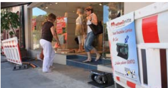
Ersatzleitungen wurden kundenfreundlich verlegt

Die Stadt Rottweil als auch das durchführende Energieversorgungsunternehmen ENRW legten bereits im Zuge der Neuverlegung der Gasleitungen viel Wert auf eine offene Kommunikation der Baumaßnahme gegenüber den Anliegern, Einzelhändlern sowie der Presse. Im Juli