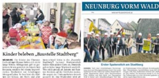
Presseberichte, Neunburg vorm Wald