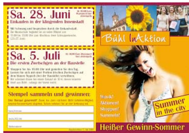
Flyer „Heißer Gewinn-Sommer“