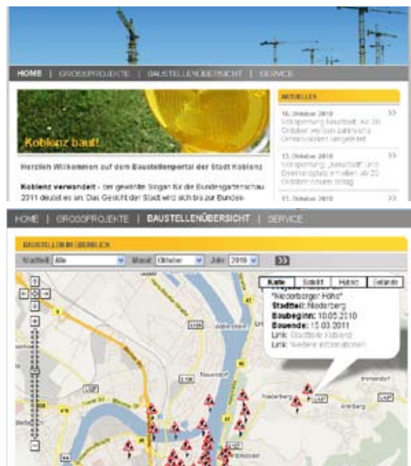
Internetplattform und dezentrale, ämterübergreifende Baustellendatenbank mit Informationen zu jeder Baustelle, Koblenz