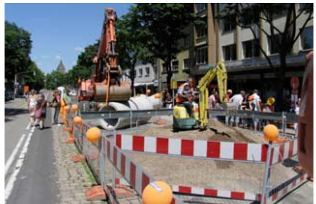
Zwei Jahre Umbau von „Hauskante zu Hauskante“

Inhaltliche Grundlage für das Marketing-Konzept, das von der Stadt Freiburg finanziert wurde, war eine Befragung aller betroffenen Gewerbetreibenden entlang der Habsburgerstraße über die bevorstehenden Baumaßnahmen. Darin wurden die Unternehmen nicht nur zu ihrer Stimmungslage zur Baustelle befragt, sie konnten auch konkrete Vorschläge zu einer möglichst reibungslosen Abwicklung machen und ihre Erwartungen an die Stadt, die Verkehrsbetriebe sowie die Bauleitung formulieren.