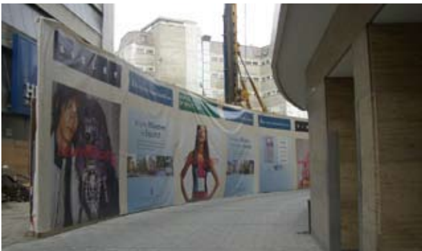
Bauzaun als Werbefläche, München