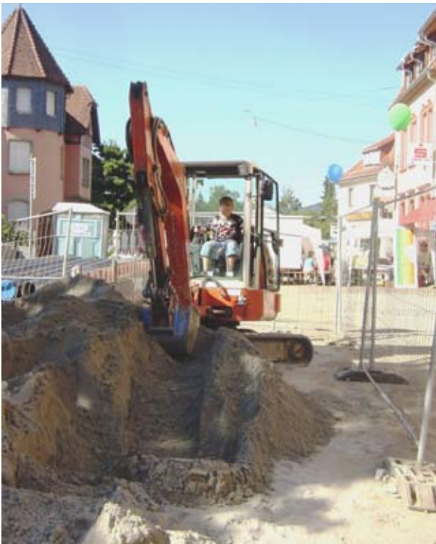
Kinderbaustelle bei einem Baustellenfest

und in Zusammenarbeit mit den betroffenen Gewerbetreibenden umgesetzt. Hierzu gehören neben der Verteilung von Infoblättern, die Schaffung von Kurzzeitparkplätzen, Erstellung von Merchandising-Produkten oder die Ausschilderung von Geschäften in Baustellenbereichen Veröffentlichung von Sonderbeilagen in der lokalen Zeitung sowie weitere situationsbedingte Maßnahmen im Sinne der Gewerbetreibenden. Während der Bauzeit und zum Ende der Baumaßnahme werden Feste im Baustellenbereich organisiert, bei denen sich die betroffenen Betriebe präsentieren können. Die gemeinsam am Runden Tisch konzipierten Marketingmaßnahmen tragen dazu bei, dass die Betriebe sich mit der Baumaßnahme identifizieren vor Ort ein „Wir-Gefühl“ entsteht und Kundenfrequenz aufrechterhalten wird. Der Erfolg zeigt sich daran, dass oft noch lange nach Beendigung einer Baumaßnahme gemeinsame Treffen und Aktionen durchgeführt werden.