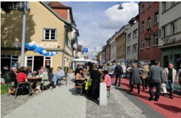
Eröffnungsfest: Bei strahlendem Sonnenschein strömten die Besucher in die umgestaltete Obere Breite Straße