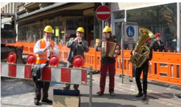
Baustellen-Musikanten, Fürth