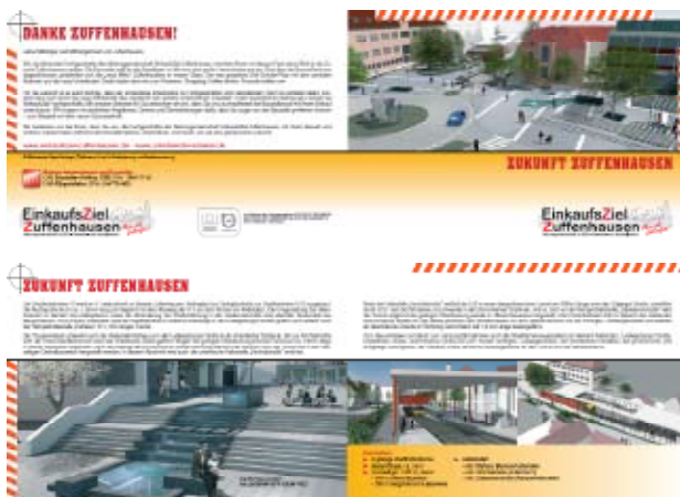
Infobroschüre der Aktionsgemeinschaft Einkaufszentrum Zuffenhausen; Grafik: EZZ

Die Bautätigkeit vollzieht sich seit Sommer 2008 und wird bis Ende 2011 reichen. Die Haupteinkaufsstraßen werden hierzu abschnittsweise aufgerissen, mit grobem Gerät bearbeitet und so in ihrer Verkehrs- und Parkierungsleistung stark eingeschränkt.