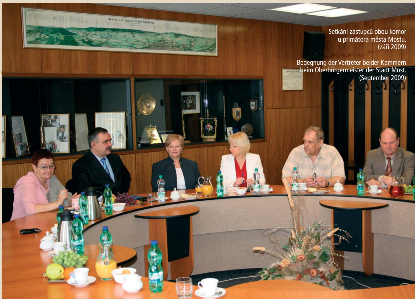
Setkání zástupců obou komor u primátora města Mostu. (září 2009)