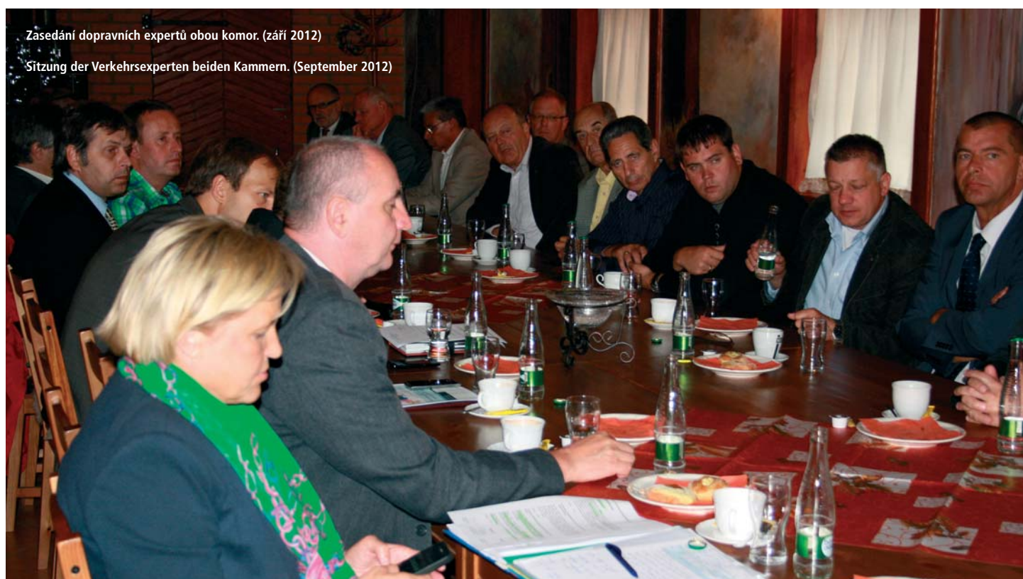
Sitzung der Verkehrsexperten beider Kammern. (September 2012)