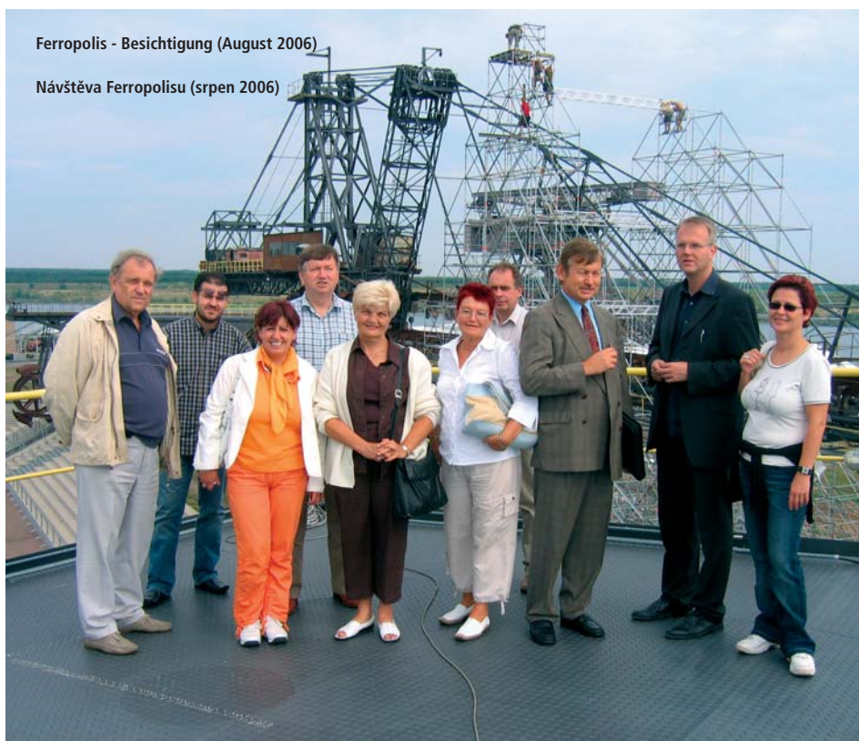
Návštěva Ferropolisu (srpen 2006)