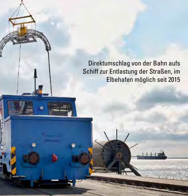
Direktumschlag von der Bahn aufs Schiff zur Entlastung der Straßen, im Elbehafen möglich seit 2015