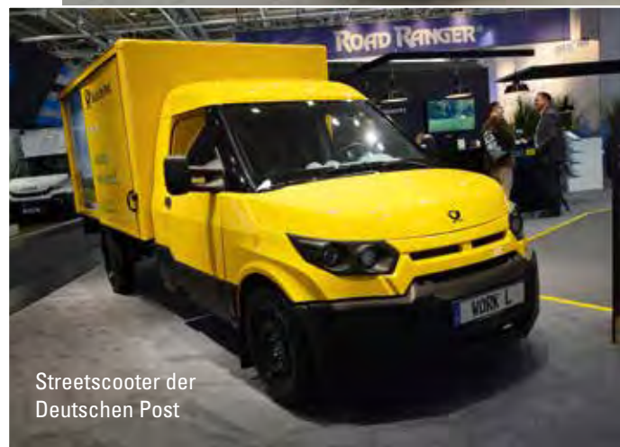
Streetscooter der Deutschen Post