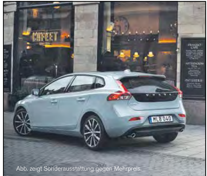
Abb. zeigt Sonderausstattung gegen Mehrpreis.