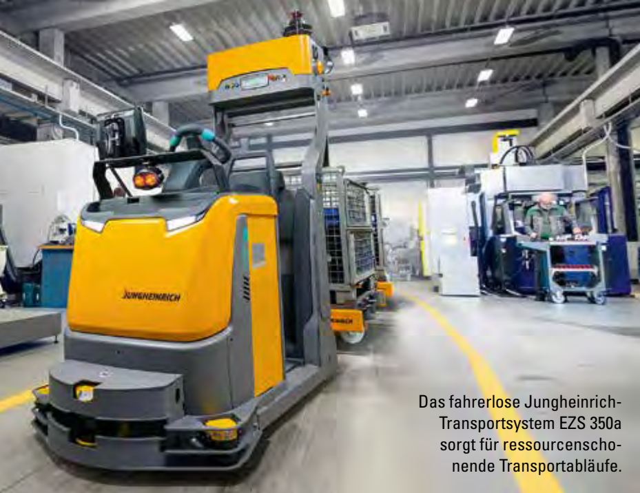
Das fahrerlose Jungheinrich-Transportsystem EZS 350a sorgt für ressourcenschonende Transportabläufe.