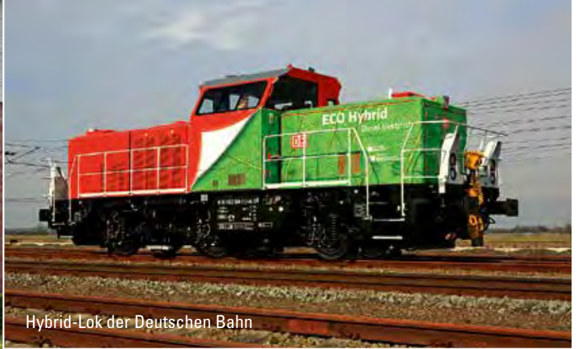
Hybrid-Lok der Deutschen Bahn