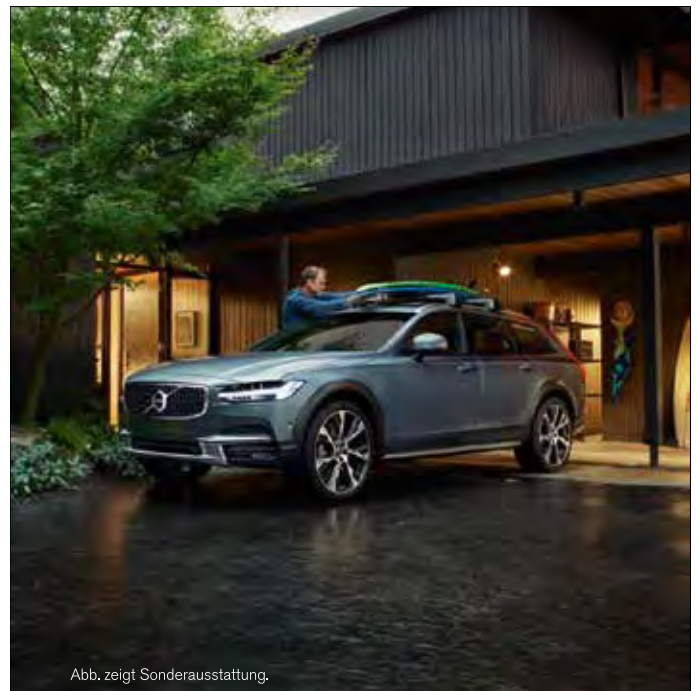
Abb. zeigt Sonderausstattung.