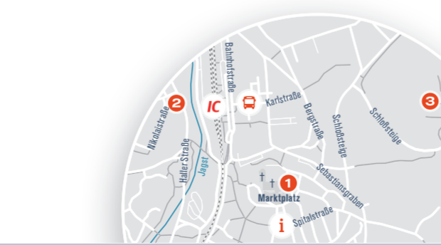
Carsharing: Am Bahnhof Ellwangen steht Ihnen 1 Fahrzeug zur Verfügung.

Erreichbarkeit vom Bahnhof: 15 Minuten → 3