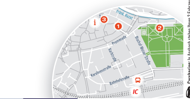
Carsharing: In Ansbach stehen Ihnen 2 Fahrzeuge im näheren Bahnhofsumfeld zur Verfügung.

Erreichbarkeit vom Bahnhof: 9 Minuten → 3