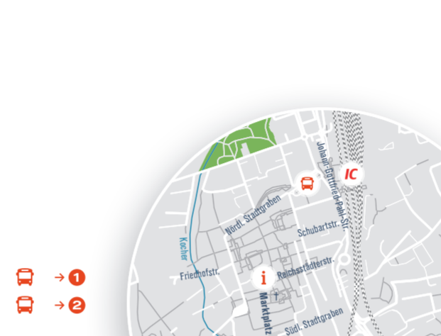
Carsharing: Ab Sommer 2016 steht Ihnen in Aalen 1 Fahrzeug am Bahnhof zur Verfügung.

Erreichbarkeit vom Bahnhof | ZOB: 12 Minuten → 2 Linie 82, 83: Aalen Bahnhof | ZOB - Tiefer Stollen