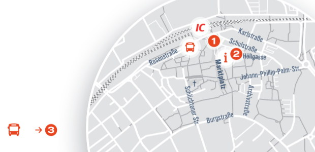
Carsharing: Am Bahnhof Schorndorf steht Ihnen 1 Fahrzeug zur Verfügung.

Erreichbarkeit vom Bahnhof | ZOB: 10 Minuten Linie 242: Schorndorf Bahnhof | ZOB - Haydnstraße