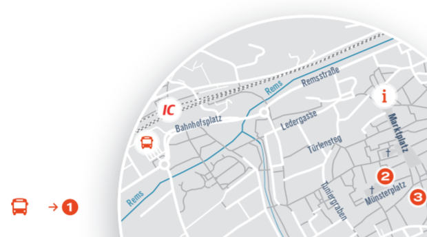
Carsharing: Am Bahnhof Schwäbisch Gmünd stehen Ihnen 2 Fahrzeuge zur Verfügung.

Erreichbarkeit vom Bahnhof: 12 Minuten → 3