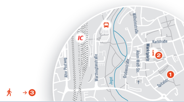
Carsharing: Am Bahnhof Crailsheim steht Ihnen 1 Fahrzeug zur Verfügung.

Erreichbarkeit vom Bahnhof: 10 Minuten → 3