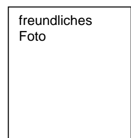
Verkaufsleiterin Petra Kleine

Wir freuen uns auf Ihr Praktikum/Ihre Ferientätigkeit. Weitere Informationen erhalten Sie unter: