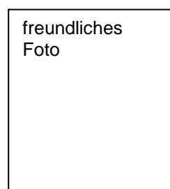
Küchenchefin Irene Lange