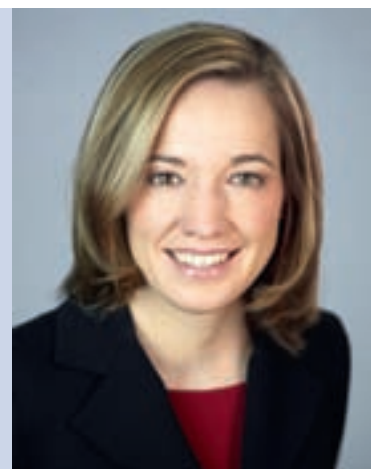
Dr. Kristina Schröder Bundesministerin für Familie, Senioren, Frauen und Jugend