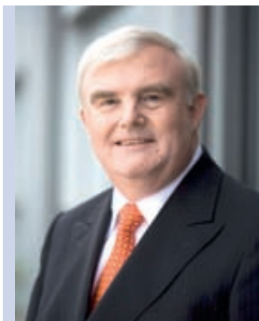
Prof. Dr. Hans Heinrich Driftmann Präsident des Deutschen Industrie- und Handelskammertages

Gemeinsam setzen wir uns für eine Arbeitswelt ein, die Beschäftigten Zeit für Verantwortung lässt. Denn vor allem dort, wo gut ausgebildete Frauen und Männer als Eltern oder als pflegende Angehörige Zeit und Raum für Verantwortung haben, werden sie auch künftig arbeiten und leben wollen.