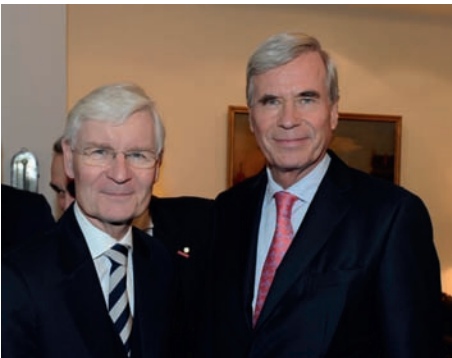
Hamburgs ehemaliger Erster Bürgermeister Dr. Henning Voscherau (li.) und Dr. Michael Otto