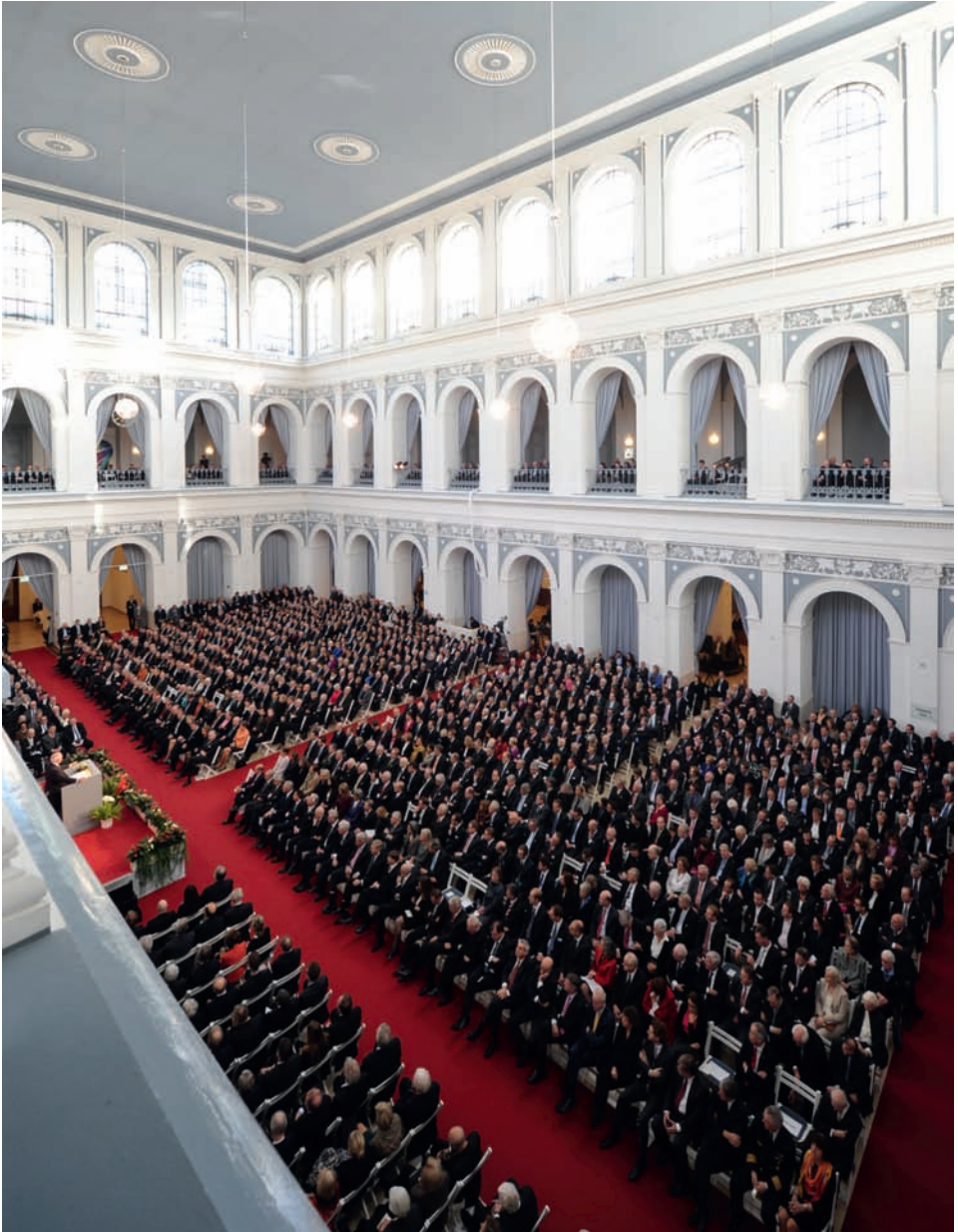
Der Börsensaal der Handelskammer war wie jedes Jahr bis fast auf den letzten Platz besetzt