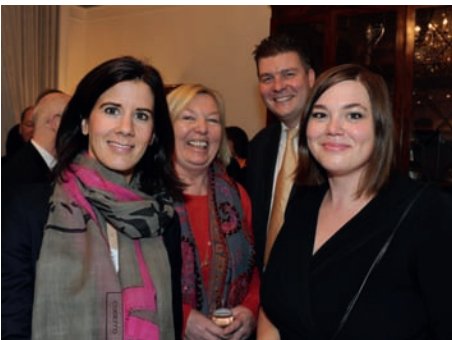
Die Politiker Katja Suding, Dora Heyenn, Dr. Andreas Dressel und Katharina Fegebank (v. li.)