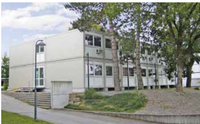
Auch Großraum-Projekte auf mehreren Etagen gehören zum Lieferportfolio des Containerspezialisten ELA.

sind die ELA-Premium-Mietcontainer, die einen halben Meter breiter sind. Was einst in Haren begann, ist inzwischen in ganz Deutschland und Europa erfolgreich. „In der Region Emsland-Osnabrück liegen unsere Wurzeln. Sie geben uns die Kraft, auch weiterhin überregional erfolgreich zu agieren“,