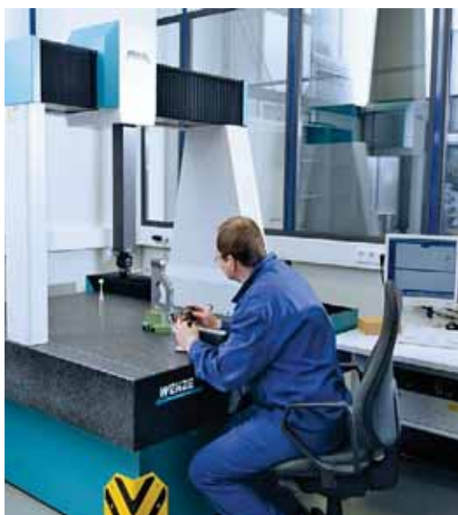
Anspruchsvolles Qualitätsmanagement: Die Messmaschine liefert präziseste Ergebnisse.

Inzwischen sind 35 Beschäftigte an Bord. Das mittelständische Unternehmen ist auf einer Gesamtfläche von 5000 angesiedelt. Der hochmoderne Maschinenpark ist auf einer Produktionsfläche von rund 800 m 2 untergebracht. Der Bürobereich umfasst 200 m 2 . Im nächsten Jahr wird eine weitere, circa 300 m 2 große Halle neu gebaut um den Komplex zu ergänzen.