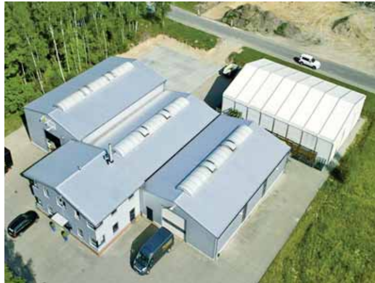
Das Firmengelände der CNC-Technik Jansen GmbH in Lingen aus der Luft betrachtet.