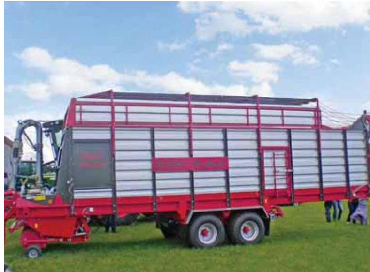
Ein eigenes Produkt aus dem Hause Keibel Maschinenbau, ein Lade- wagen für die Landwirtschaft.

Die Ausrichtung des Unternehmens auch in der sehr großen Fertigungstiefe bietet nahezu alle Möglichkeiten. Durch den enorm großen Maschinenpark ist es möglich Einzelteile oder Großserien zu fertigen. Je nach Kundenanforderung werden einfache Schweißbaugruppen aber auch komplexe, betriebsbereite Maschinen produziert. Aus der Standortwahl heraus ergibt für alle Geschäftspartner ein charmanter Vorteil: Problemlose Kommunikation in deutscher, englischer und