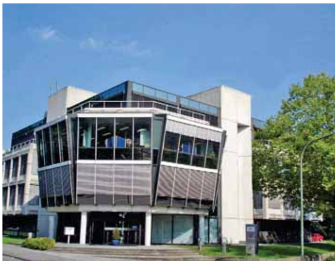
Die Firmenzentrale der CCE Group in Osnabrück.

tiver Software-Lösungen und der entsprechende Service gehören ebenfalls zum Leistungsspektrum. Durch dieses Zusammenspiel der einzelnen Disziplinen, kann die CCE Group ihren Kunden ein deutliches „Mehr an Leistungen und Qualität“ bieten.