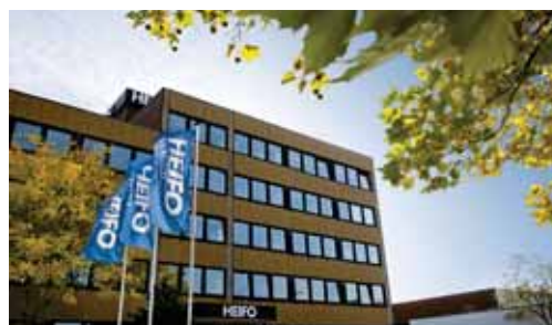
Der HEIFO-Standort an der Hannoverschen Straße 49 in Osnabrück.