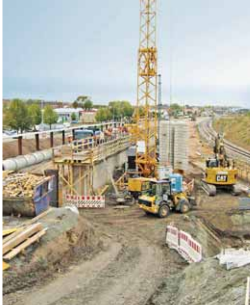
Neubaustrecke Knoten Erfurt – Alles aus einer Hand – Ingenieurbau – Bahnbau – Kanalbau.

Aufgliedern lässt sich das Unternehmen in drei Fachbereiche: Infrastruktur (bestehend aus Bahnbau, Gleisbau, Straßenbau, Kanalbau und Umwelttechnik), Ingenieurbau und Hochbau.