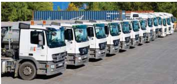
Ein moderner Fuhrpark im Zweischichtbetrieb sichert die kontinuierliche Versorgung des Unternehmens mit den Rohmaterialien und schafft Möglichkeiten, Kundenwünsche kurzfristig zu erfüllen und deren Baustellen zu beliefern.

dauerhaft gewachsen sind und deren Haltbarkeit erheblich verlängert wird. Die im Jahr 2008 in Betrieb genommene Produktionsanlage mit automatisierter Steuerung und einem flexiblen Förderbandsystem erlaubt variable Produktionsabläufe, um Kundenwünsche noch schneller umsetzen zu können. Außerdem garantiert eine konsequente Eigen- und Fremdüberwachung eine gleichbleibend hohe Qualität. Somit ist eine zertifizierte werkseigene Produktionskontrolle und die CE-Kennzeichnung der güteüberwachten Produkte, sowie die Zertifizierung zum Entsorgungsbetrieb und die Implementierung eines integrierten Qualitäts-, Umwelt- und Arbeitsschutzmanagementsystems für die Geschäftsleitung eine Selbstverständlichkeit.