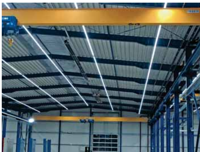
Großes Sparpotenzial: Dank tageslichtabhängiger Schaltung der Beleuchtung sind in dieser 6 000 m 2 großen Halle ca. 50 000,- Euro Einsparung pro Jahr möglich.