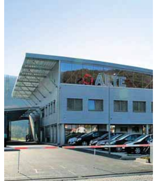
Neubau Produktionshalle und Büro in Plettenberg.