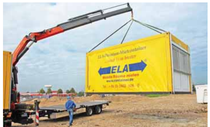
ELA-Container werden punktgenau per LKW-Ladekran zur Baustelle geliefert.