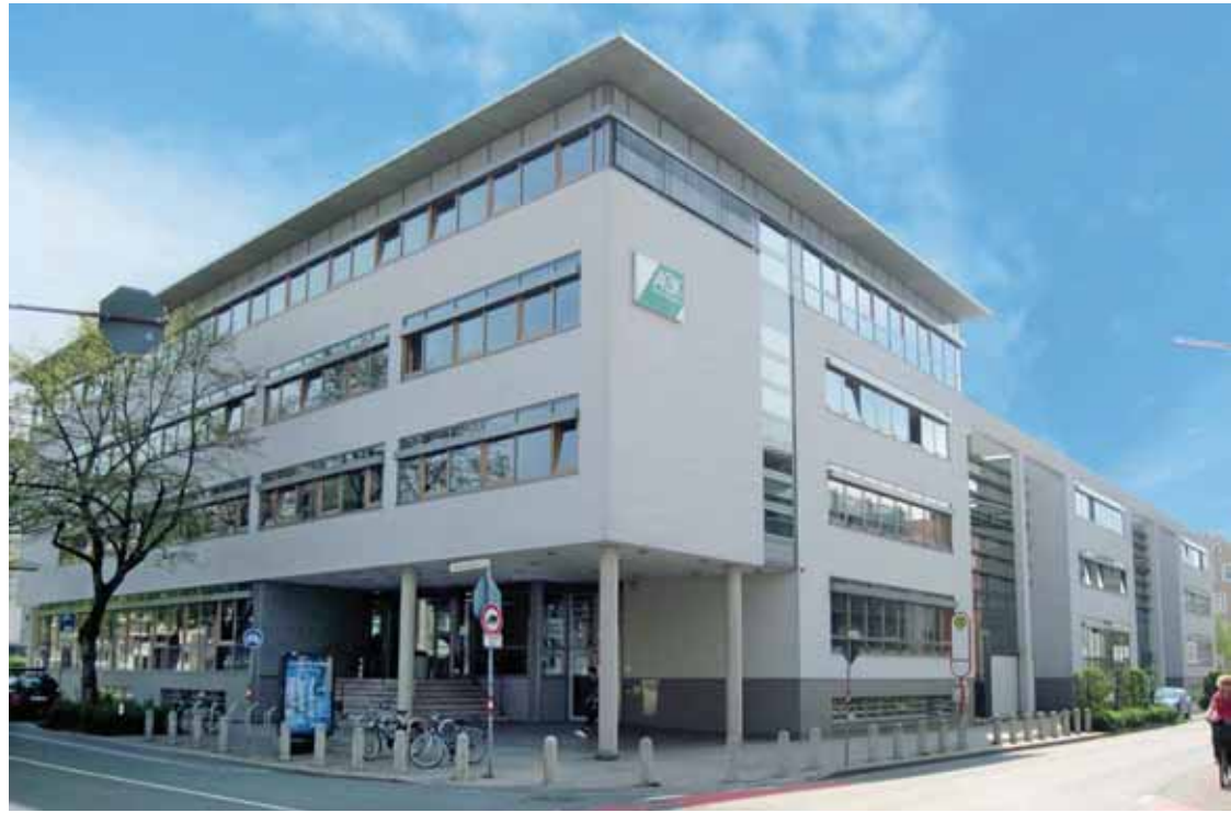
Das AOK Servicecenter in der Niedersachsenstraße 10 in Osnabrück.