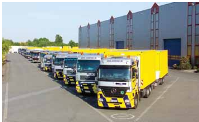
50 werkseigene LKW liefern die mobilen ELA-Räume europaweit aus, die Übergabe erfolgt nach der Montage schlüsselfertig.

sende und moderne Kommunikationstechnik. Das integrierte Belüftungssystem in den Fenstern sorgt für ein angenehmes und gesundes Raumklima in den ELA-Räumen. Für Maschinen, Aggregate oder Schaltanlagen bietet ELA je nach Kundenwunsch auch Sonder- und Spezialkonstruktionen an.