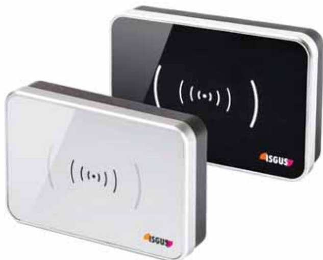
Terminal zur Zutrittskontrolle IT 4100 in schwarz und silbermetallic.

für Zutrittskontrolle konnte die ISGUS Unternehmensgruppe den wechselnden Anforderungen der Kunden gerecht werden. Die Smartphone Optik der Terminals IT 4100 & 4110 & 4210 & 4210 FP integriert sich dezent in jegliche Unternehmensstruktur und wird dem Anspruch einer hochwertigen Firmenausstattung mehr als gerecht. Es folgt nun eine weitere Designanpassung. Die Terminals sind ab sofort auch mit einer Tastatur in silbermetallic erhältlich.