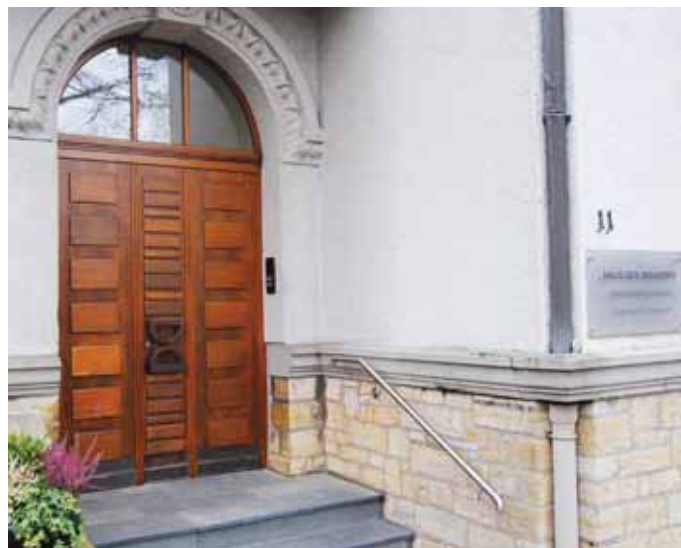
Das Haus der Industrie an der Bohmter Straße 11 in Osnabrück.

Bildungsreferentin Birgit Tovar Wirtschaftsplanspiele