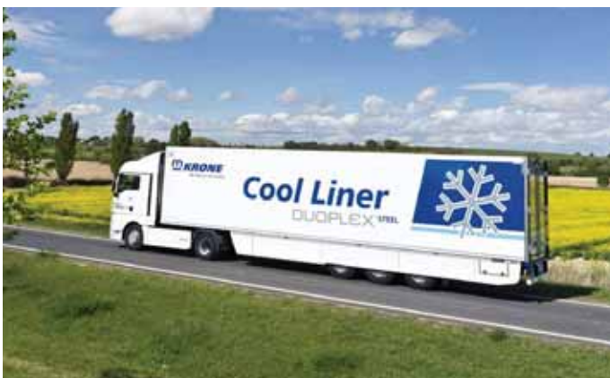
Der Name Krone steht für vielfach ausgezeichnete Trailer-Kompetenz, z. B. der Cool Liner Duoplex Steel.

sowie Pressen. Darüber hinaus bietet Krone zwei Selbstfahrer-Baureihen an: zum einen die selbstfahrenden Hochleistungs-Mähaufbereiter BiG M 400 und BiG M 500 mit Stundenleistungen von bis zu 20 ha. Und mit dem Exakt-Feldhäcksler BiG X 1100 (mit 1 078 PS) stellt Krone nach wie vor die stärkste Landmaschine der Welt.