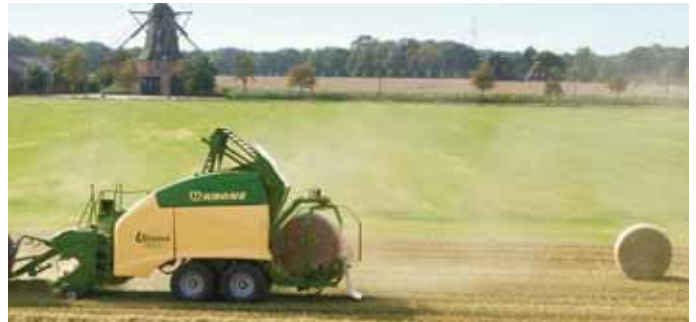
Weltweit die erste vollautomatisierte Non-Stop Rundballen-Presswickelkombination, Krone Ultima.

Im Bereich Landtechnik hat Krone sich auf das Grundfuttersegment spezialisiert und zeichnet sich durch Technologie- und Qualitätsführerschaft aus. Die rasante Innovationsgeschwindigkeit sichert Krone den weltweiten Erfolg. Jüngstes Beispiel ist die weltweit erste vollautomatisierte Rundballenpresswickelkombination Ultima, die beim Abbinden und Entladen der Ballen weiter fahren kann, was die Durchsatzleistung der Maschine um bis zu 50 % steigert. Die Ultima ist nur ein Beispiel für herausragende Krone Innovation; dank des kontinuierlichen Redesigns des Programms steht der Name Krone seit Jahren für Technologieführerschaft in den Bereichen Scheibenmäherwerke, Kreiselzettwender, Kreiselchwader, Lade-/Dosierwagen