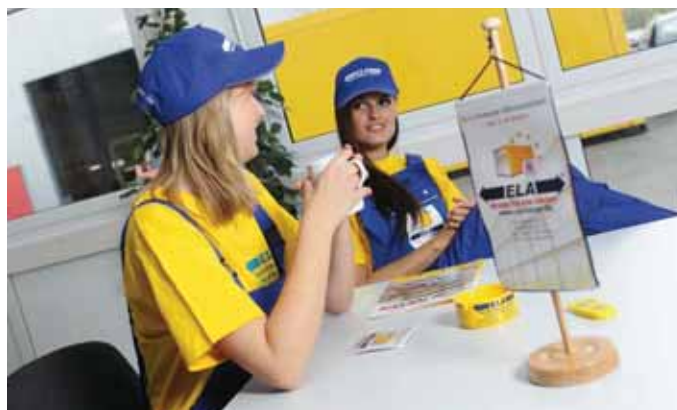
Mobile Räume zum Wohlfühlen: Vielfältige Einsatzmöglichkeiten zeichnen die ELA-Räume aus.

Im Laufe der Entwicklung stieg insbesondere die Nachfrage nach Baucontainern. ELA entwickelte branchenexklusiv einen eigenen Container – den so genannten ELA-Premium-Mietcontainer. Neu