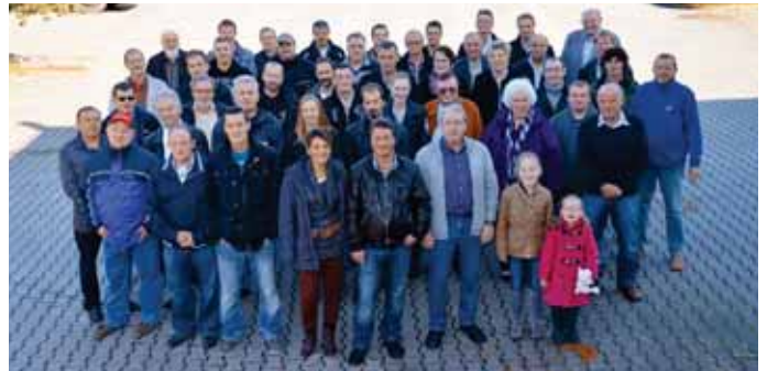
Einen weiteren Garant für den Unternehmenserfolg bilden die insgesamt 45 treuen und engagierten Mitarbeiter in einem familiären Umfeld.

Die Umstellung der Stahlproduktion vom Siemens-Martin-Verfahren zur Stahlschmelze im Elektrolichtbogenofen war für die Verwendungsfähigkeit der Stahlwerksschlacken von großer Bedeutung. War der Einsatz bislang auf den allgemeinen Erd- und Wegebau beschränkt, so ist die Elektroofenschlacke auch für den Einbau als Frostschutz- und Schottertragschichten im Straßenbau, zu Edelsplitten aufbereitet als Zuschlagsstoff für die Asphaltin-