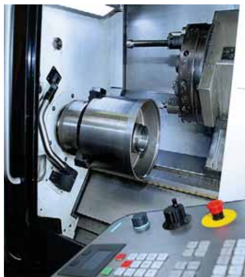
Die Jansen GmbH kann in der Metallverarbeitung auf modernste Maschinen zurückgreifen.