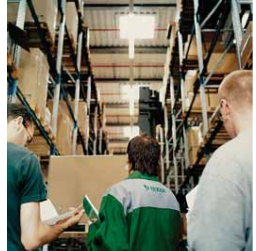
Lager- und Transportlogistik sind Schwerpunkte der Qualifizierung.

bildungsmanagement. Um den Bedürfnissen der Kunden noch besser gerecht zu werden, baut die DEKRA Akademie neben den öffentlich geförderten Angeboten ihre Leistungen für private Auftraggeber ständig aus. Durch den modularen Aufbau und flexiblen Einsatz dieser Angebote lassen sich schnell Qualitätsverbesserungen erzielen und die Prozesssicherheit bei den Kunden erhöhen.