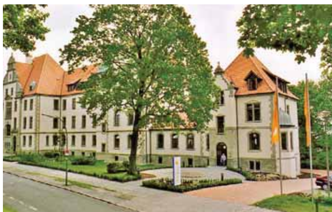
BKK firmus-Servicezentrum an der Knollstraße.

Die BKK firmus beschäftigt über 125 Mitarbeiterinnen und Mitarbeiter, die über 83 000 Kunden und mehr als 10 000 Arbeitgeber bundesweit betreuen –