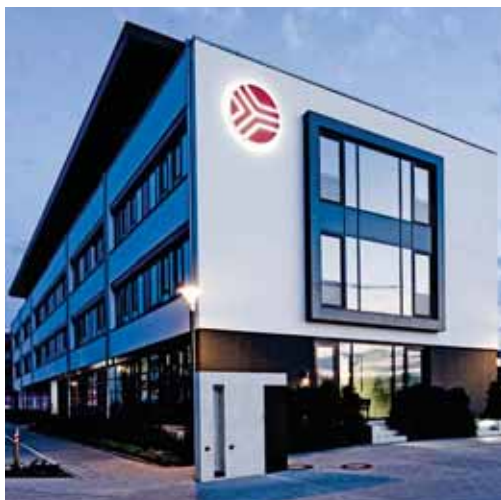
Vorzeigebauwerk für Energieeffizienz: Das Stadtwerke-Bürogebäude in Passivbauweise.

Die Stadtwerke sehen sich bei all ihren Aktivitäten in einer Doppelrolle: als Wegbereiter, indem sie selber in innovative Maßnahmen investieren sowie als Wegbegleiter, indem sie die Kunden beraten, welchen Beitrag jeder einzelne leisten kann – zum Wohle der Umwelt und der Region.