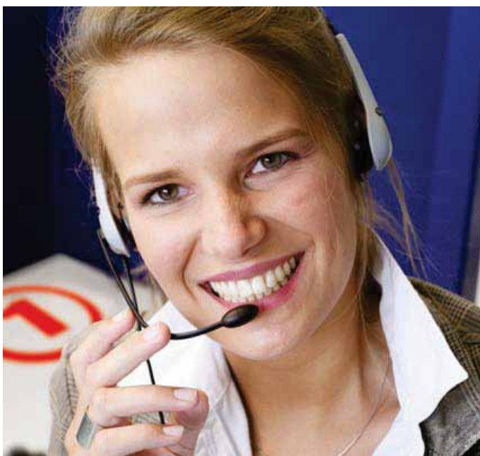
Die buw-Mitarbeiter geben alles dafür, ihre Auftraggeber zur Nummer 1 in ihrem Markt zu machen.

Kommunikationsthemen in jeder Größenordnung über sämtliche klassischen und neuen Kanäle wie Telefonie, E-Mail oder Social Media.