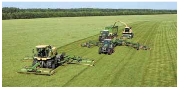
Schlagkraft pur – Ernte à la Krone.