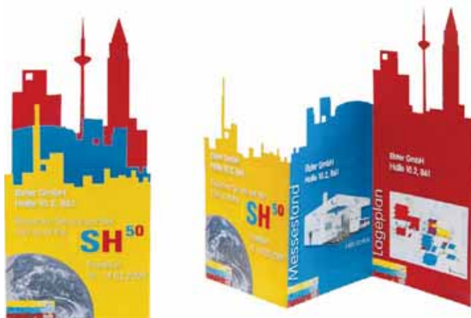
Flyer mit eingestanzter Skyline als Messeeinladung.