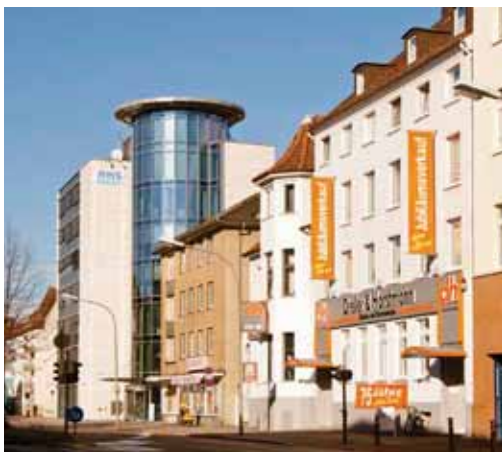
Die Fassade des Geschäftshauses am Goethering in der Osnabrücker Innenstadt: Auf der Rückseite stehen zahlreiche Parkplätze zur Verfügung.

Im insgesamt 13-köpfigen Team des Modehauses wird auf Treue besonders Wert gelegt. „Viele Mitarbeiter sind Urgesteine“, erzählt der Juniorchef. Sie sind auch am Einkauf der Kleidung beteiligt. Das trage zu einer hohen Identifikation mit der Ware und der Firma bei, betont er.