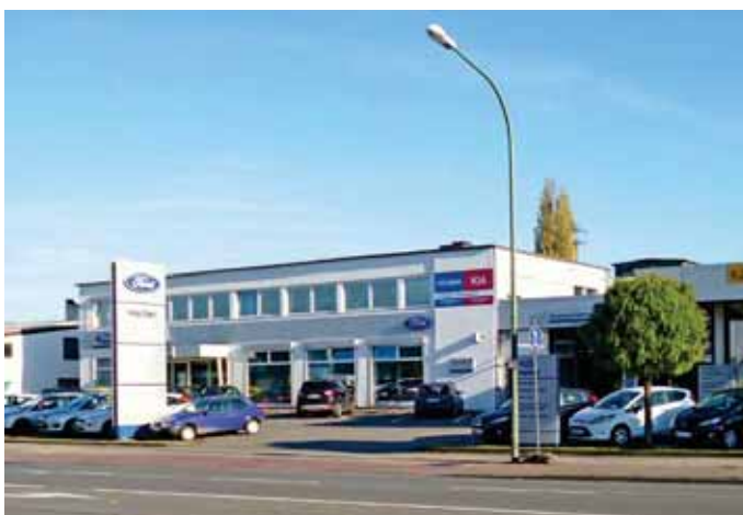
Ford Heiter in Osnabrück: Auf 16 800 m 2 werden Privatkunden, Gewerbe- und Flottenkunden an der HansasträÙe 33 professionell in allen Sparten betreut.

Die Geschäftsführung legt u. a. sehr viel Wert auf die persönliche und fachliche Entwicklung der 69 Mitarbeiter, denn Wertschät-