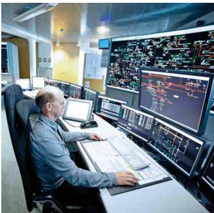
In der hochmodernen Netzleitstelle wird das Stromnetz gesteuert.

RWE ist überall dort vertreten, wo das Netz ist – an sieben Standorten in der Region. Die regionalen Einheiten von RWE sind eng miteinander vernetzt und in den großen RWE Konzern eingebunden. Die Vorteile: ein effizienter Mitarbeiterinsatz und ein Maximum an Synergien.