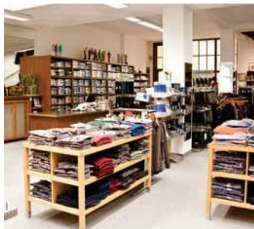
Das Modehaus führt hochwertige Damen- und Herrenbekleidung von rund 30 namhaften Herstellern.