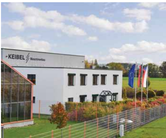
Die Einkaufs- und Vertriebsorganisation der Keibel Maschinenbau GmbH befindet sich am Standort Bad Essen/Rabber.