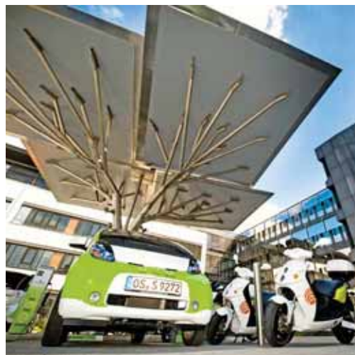
Stadtwerke verbinden Innovationen: Elektrofahrzeuge laden grünen Strom am Solarbaum.