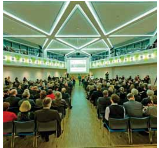
Vielfältige Einsatzmöglichkeiten: Ein Tagungsraum, ausgestattet mit zwei verschiedenen, dimmbaren Lichtfarben (Warmton und Tageslicht.) und bis zu 1 000 Lux Helligkeit.

bzw. Bewegungsmelder geeignet. Mit Hilfe von Licht-Konstant-Reglern kann eine Tageslicht abhängige Steuerung realisiert werden. Es wird nur soviel Licht erzeugt, wie tatsächlich benötigt wird. Lichtfarben der LED Technik sind von Warmweiß (3 000 K / Leuchtstofflampenfarbe 830), weiß (4 500 K / Leuchtstofflampenfarbe 840) und Tageslicht (6 000 K / Leuchtstofflampenfarbe 865) lieferbar.