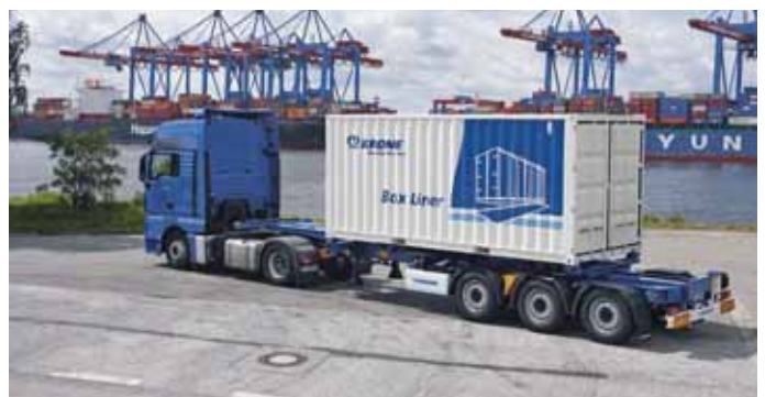
Für den harten Containeralltag bietet Krone robuste Chassis und Wechselkoffer.

sowie Pressen. Darüber hinaus bietet Krone zwei Selbstfahrer-Baureihen an: zum einen die selbstfahrenden Hochleistungs-Mähaufbereiter BiG M 400 und BiG M 500 mit Stundenleistungen von bis zu 20 ha. Und mit dem Exakt-Feldhäcksler BiG X 1100 (mit 1 078 PS) stellt Krone nach wie vor die stärkste Landmaschine der Welt.