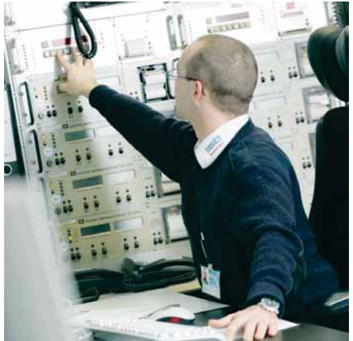
Kontrolle des Kundeneigentums zu jeder Uhrzeit: Wenn der Alarm klingelt, sind die Mitarbeiter umgehend vor Ort.

Sicherheitsdienste, Notruf- und Serviceleitstelle, Sicherheitstechnik, Arbeitnehmerüberlassung – es gibt heute kaum ein Feld, auf dem das Unternehmen nicht als kompetenter und seriöser Partner für Ihre Sicherheit agiert – und das auch weit über die Grenzen der Region hinaus. Die qualifizierten und zertifizierten technischen Lösungen bietet – bundesweit aus z. Zt. neun Standorten – das Schwesterunternehmen ATG Sicherheitstechnik GmbH.