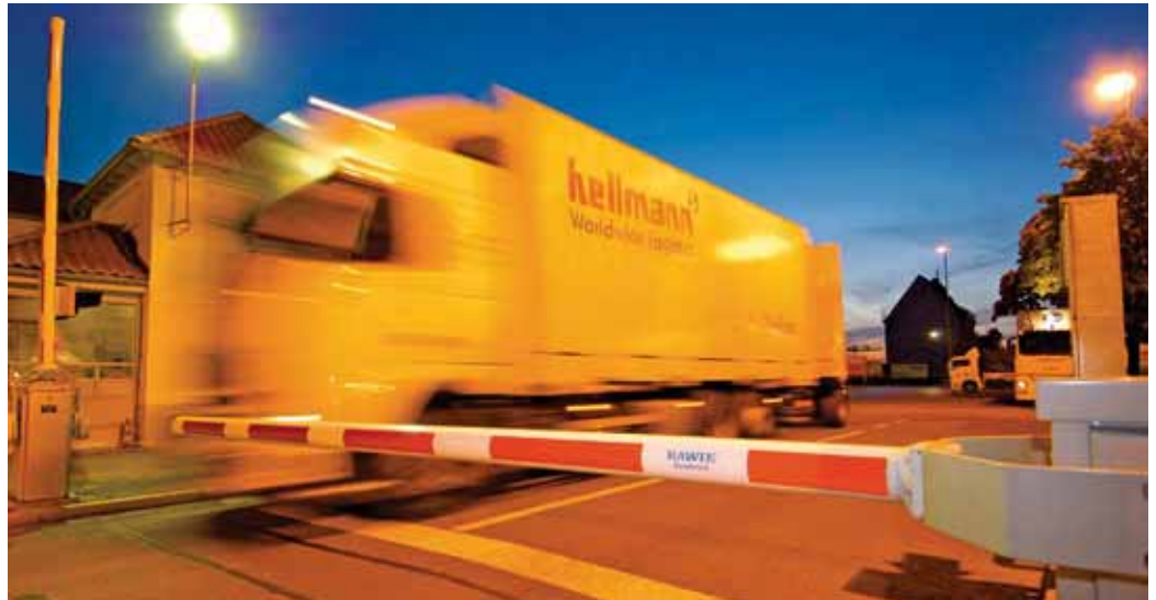
Zuverlässige, robuste Schrankensysteme für den täglichen Dauerbetrieb im industriellen Einsatz.

RAWIE entwickelt, produziert und installiert zudem Schrankenanlagen und Zugangskontrollsysteme – seit mehr als 90 Jahren und für nahezu jede Anwendung. Die vielseitigen Schrankensysteme – von der manuellen Handschranke bis hin zu kamerabasierten, computergesteuerten Zugangssystemen – finden sich weltweit.