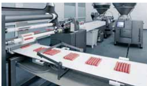
HEIFO liefert modernste Technik für Profis.

HEIFO stellt jedes Jahr Ausbildungsplätze für den Groß- und Außenhandelskaufmann/-Frau sowie für den Mechatroniker(in) für Kältetechnik zur Verfügung. Der Betrieb setzt stark auf den Nachwuchs und bietet hier ein breites Spektrum an Unternehmensblicken während der Ausbildung. Nur durch eine intensive Weitergabe des vorhandenen Wissens in Kombination mit einer konsequenten Weiterentwicklung kann HEIFO seinen positiven Wachstumspfad weiterhin bestreiten!