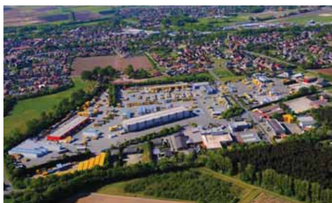
Auf dem 200 000 m 2 großen ELA-Werksgelände in Haren (Ems) befindet sich das Mietcenter und die Zentrale von ELA Container.

an diesem Modell ist die drei Meter Breite. Damit bietet er 3 m 2 mehr Innenraum als herkömmliche Lösungen.