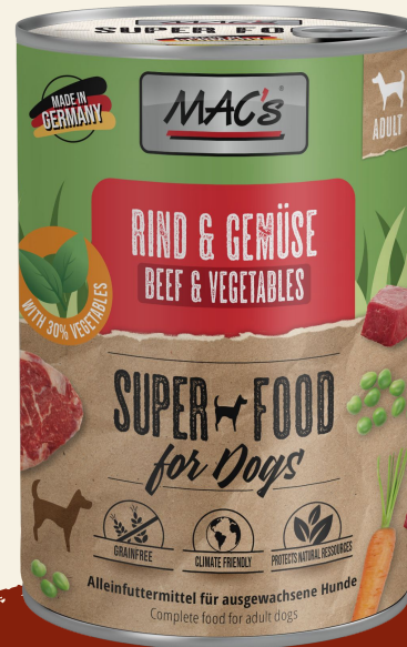
Rind & Gemüse