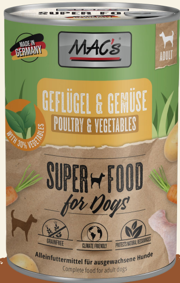
Geflügel & Gemüse