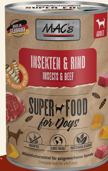
Insekten & Rind