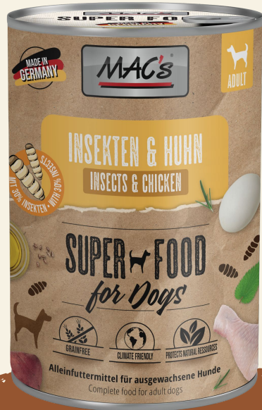
Insekten & Huhn