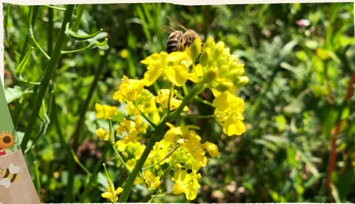
Wildblumen für zu Hause + große Blühwiese in der Eifel