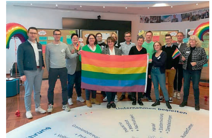
LSBTIQ+ Netzwerktreffen der IHKs in Bochum, 30. und 31.03.2022